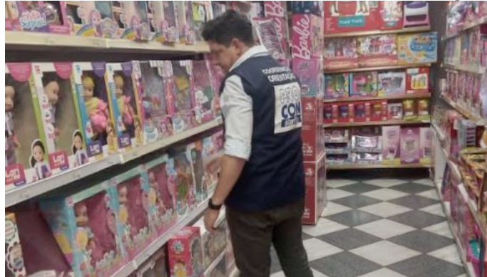
Diretor do Procon durante pesquisa em loja de brinquedos; grande variação de valores

Em Marília, o levantamento foi feito em quatro lojas, em setembro, e comparou 38 itens, como: jogos; massas de modelar; bonecas e bonecos. A maior