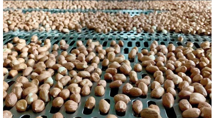
Cultura e beneficiamento de amendoim é uma das principais fontes da economia

escolaridade da maioria é ensino médio completo.