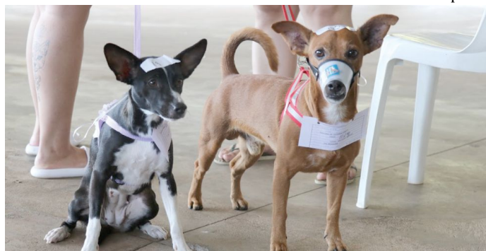
Cães em mutirão de castração gratuita; ação na região Leste é adiada em Marília

Mutirão ocorreria na região Leste, mas houve baixa procura por cadastro P2