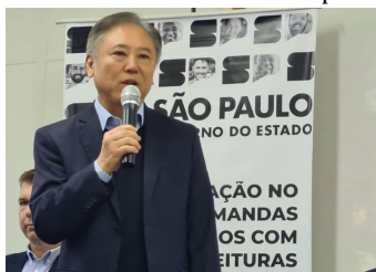
Walter Ihoshi representa governo de SP

Ihoshi participa de programa que apoia pacientes P5