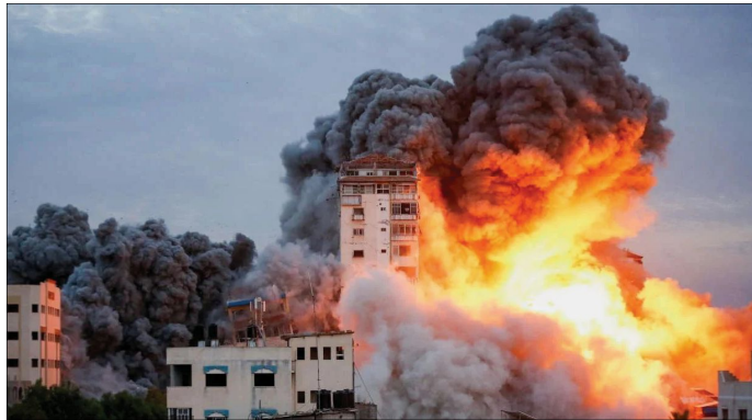
Imagem de bombardeio; situação é mais preocupante na região da Faixa de Gaza

é o de turismo. Outros setores comerciais e empresariais de Marília e região, principalmente na área de tecnologia, ainda estão mensurando os efeitos. “Algumas empre-