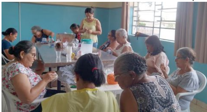
Mulheres durante atividade de oficina que é realizada semanalmente no Cras