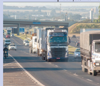
Rodovia deve receber 141 mil veículos

O plano de saúde ideal para o seu negócio