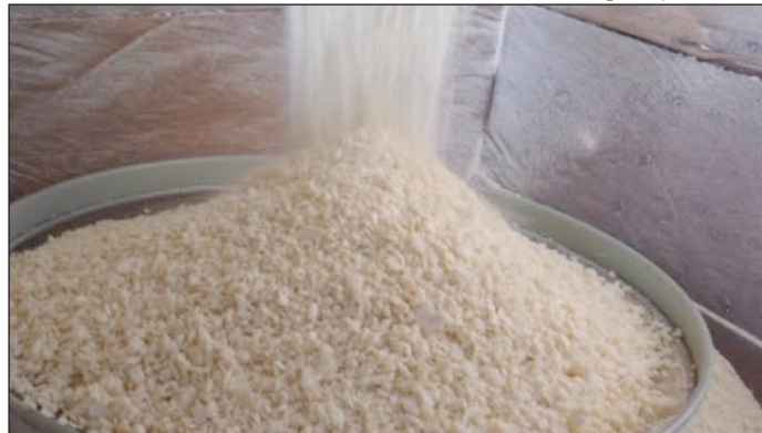
Produção de farinha de mandioca; atividade movimentada a economia de Ubirajara

mitiu cinco trabalhadores e desligou três, resultando em um saldo positivo de dois. No acumulado, contratou 41 e dispensou o mesmo número. O estoque de empre-