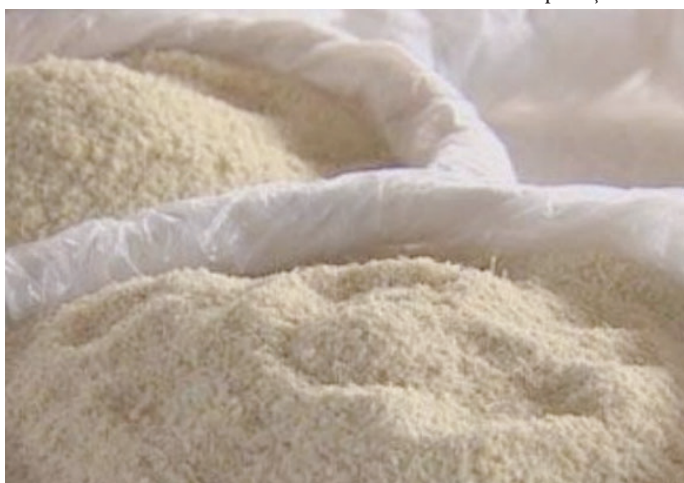
Produção de farinha de mandioca; atividade também movimentou economia local