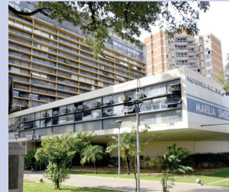
Prefeitura só reabre na segunda (16)