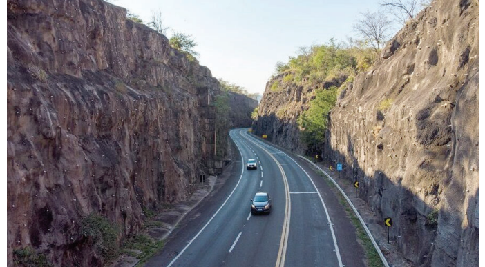
Trecho da BR-153 próximo a Ocaçu; cidade recebeu quase R$ 405 mil dos pedágios

(Mercadorias e Serviços) R$ 4,749 milhões. Volume está um pouco abaixo do encaminhado no mesmo período do ano anterior, que chegou a R$ 4,775 milhões. O