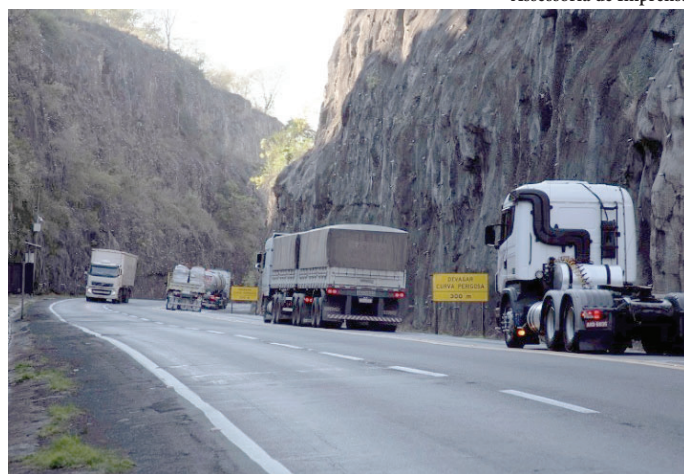
Tráfego na rodovia BR-153, que corta Ocaçu; município recebe repasses