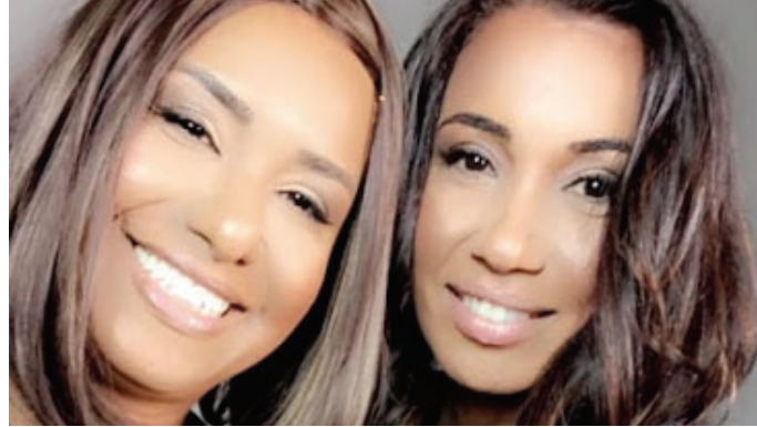
Dupla sertaneja cobra prefeitura por pagamento de apresentação em festival de Marília