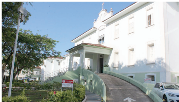
Santa Casa receberá a maior parte do recurso destinado pelo Ministério da Saúde

O primeiro hospital, com envolvimento do município na gestão, deverá ter recurso de R$ 4.311.685,99, enquanto o segundo, com envolvimento do Estado na gestão, poderá conquistar 2.349.834,27.