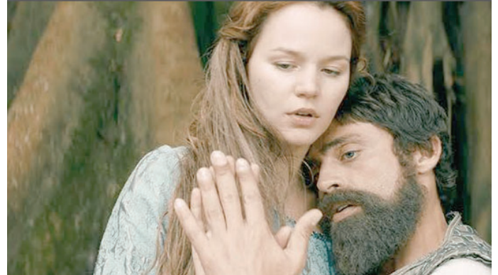
Cena do filme 'Pedro e Inês: O Amor não Descansa' de 2021 e que será exibido no sábado

catálogo inédito do "Pontos MIS" e é resultado de uma coprodução entre Portugal, França e Brasil. O longa é baseado na história real do rei Dom Pedro 1º, que desen-