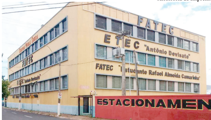
Prédio da Fatec; faculdades disponibilizam 19.445 vagas em suas unidades

Para a inscrição, é necessário preencher uma ficha com os dados pessoais, responder ao questionário socioeconômico e pagar a taxa de R$ 84 em dinheiro. No momento da inscrição, o candidato deve escolher um curso em