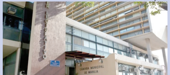
Fachada do Poder Legislativo; decisão judicial determina que projetos sejam pautados