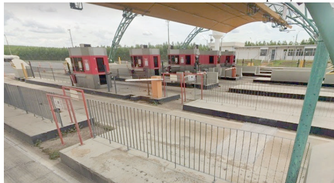
Pedágio em trecho da BR-153; valor será reajustado em 5,9% e foi autorizado pela ANTT

IPCA (Índice de Preços ao Consumidor Amplo), mesmo com a alteração de valor feita recentemente pela empresa, em julho.