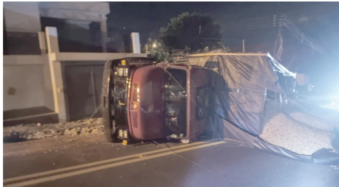
Caminhão com amendoim que tombou na Via Expressa em março e atingiu a fiação