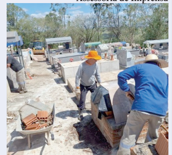
Trabalhadores atuam no Cemitério