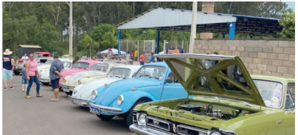
Encontro de Automobilismo será realizado pelo segundo ano em Queiroz e contará com show de banda conhecida