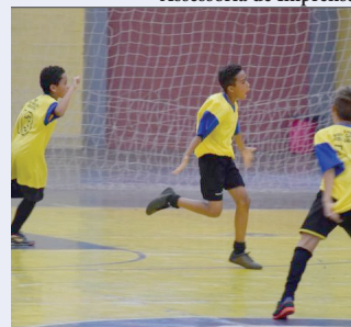
Competição esportiva; Jogos são retomados

O plano de saúde ideal para o seu negócio