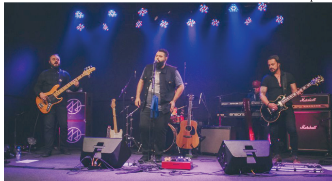
Banda Velho Night será atração na segunda edição do Encontro de Automobilismo

Carros Antigos será gratuita, mas os organizadores convidam os visitantes a contribuírem com um litro de leite do tipo Longa Vida, em prol dos