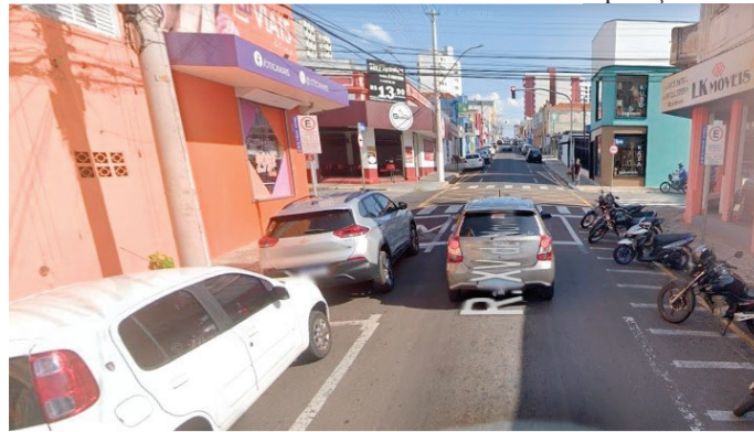
Rua Prudente de Moraes; CPFL atende pedido de não interromper serviço neste sábado

Anteriormente, a concessionária já tinha desistido de reparo que ocorreria no dia 7, quando lojas abriram até as 17h em razão