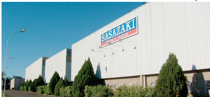
Vista da entrada da empresa Sasazaki; funcionários seguem em banco de horas