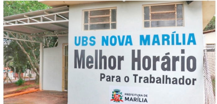
UBS Nova Marília, onde funciona o Melhor Horário; ações do 'Outubro Rosa'

Melhor Horário, que funciona na região Sul, vai atender demanda espontânea P5