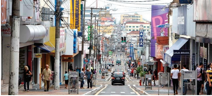
Vista do comércio central; desligamento de energia é suspenso pela concessionária