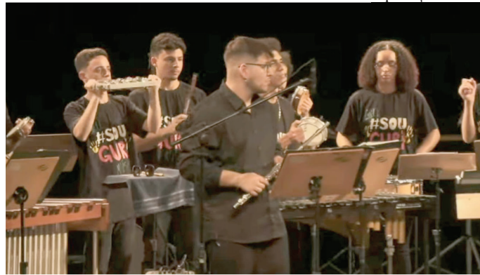
Apresentação dos alunos da Percussão do Guri aconteceu no CCI de Vera Cruz