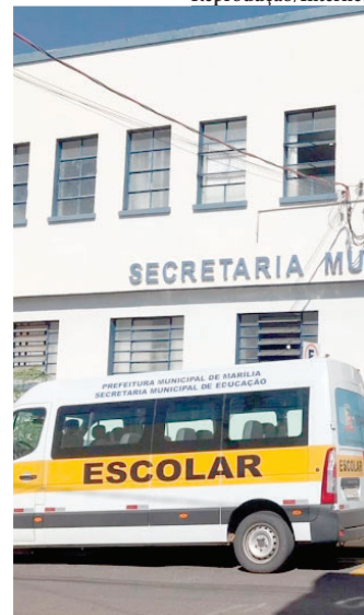
Fachada da Secretaria da Educação