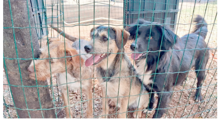
Animais domésticos são encontrados em rodovias, com risco de serem atropelados

Também é possível fazer a denúncia na base mais próxima da Polícia Militar Rodoviária.