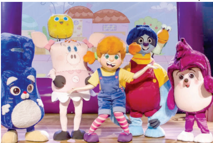
Cena da apresentação teatral 'Diário da Mika', que terá sessão gratuita no dia 28