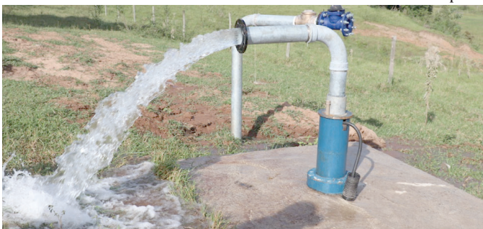
Água de Marília tem duas dezenas de substâncias agrotóxicas, segundo estudo de ONG

Água em Marília contém 22 substâncias de agrotóxicos