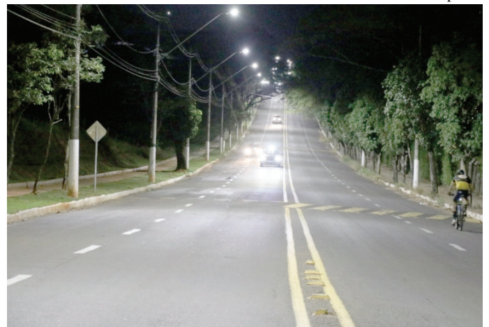
Via com iluminação em Marília; empresa vai ser contratada para manutenção

Concorrência prevê gastos de R$ 19,8 mi com iluminação P6