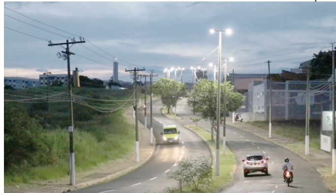
Trecho da Via Expressa com iluminação; licitação vai contratar empresa para serviço

Segundo o edital, as melhorias devem ser realizadas em ruas e avenidas, parques, edifícios e monumentos públicos. O contratado terá que fornecer material, mão de obra e equipamentos para manutenção preventiva e corretiva, eficiência, instalação, cadastro, identificação e reposi-