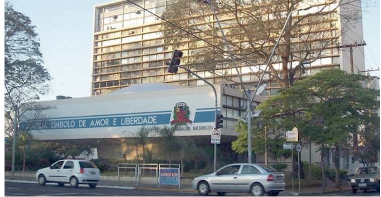
Vista do Paço Municipal; Corte dá prazo de 48 horas para prefeitura se explicar