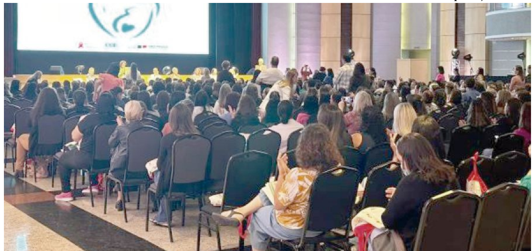
Evento de premiação de prefeituras na capital paulista; Vera Cruz é destaque em combate à transmissão vertical