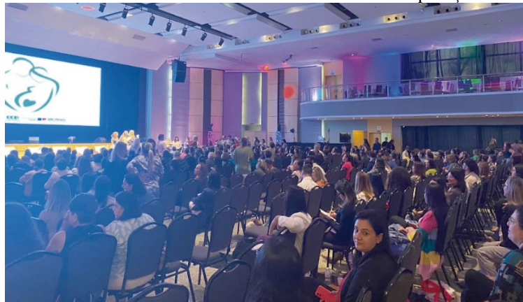
Premiação reuniu diretores de saúde dos municípios e prefeitos do estado