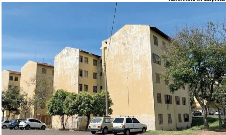
Em Marília, prédios com apartamentos estão apresentando risco na estrutura

Em todo o estado, são mais de 56 mil mutuários com dívidas