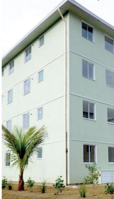
Prédios da CDHU; chance de negociar