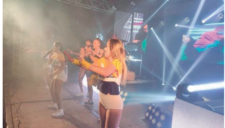
Banda Fonte Luminosa é uma das atrações do aniversário de 79 anos de Herculândia

lo Gustavo, além de exposições das artesãs da cidade", destaca.