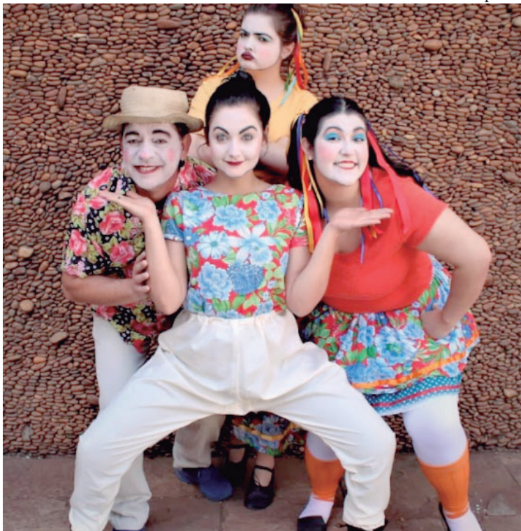
Espectáculos serão apresentados até o dia 3 de dezembro e depois ocorre capacitação