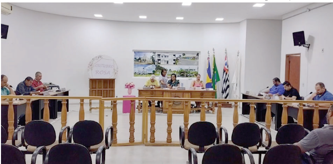
Sessão da Câmara; vereadora cobra explicações da prefeitura sobre contratação

Vereadora de Herculândia quer saber sobre contratação de crédito para obras P7