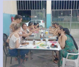
Alunas aprendem técnicas com biscuit