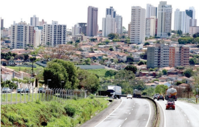
Vista da entrada de Marília; cidade supera as de mesmo porte no ranking da longevidade

Marília ocupa a 10ª posição no ranking da longevidade de 2023 P3