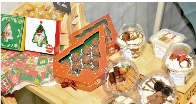
Produtos comercializados em edição de dezembro de 2022 da Feira Gourmet