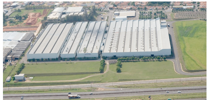
Fachada da Sasazaki; reunião ocorre nesta terça-feira na sede da empresa, na região Norte

Diretoria da Sasazaki faz nesta terça nova reunião com os colaboradores P8