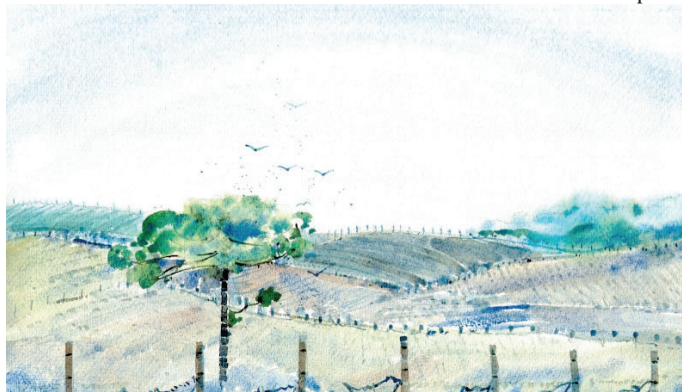
Com entrada gratuita, mostra poderá ser visitada pelo público até 9 de dezembro

Ao todo, são 40 obras do artista de Araçatuba, sendo que 20 delas retratam os cenários de Marília e outras 20 lugares por onde o autor esteve e visitou no Brasil. Todas as aquarelas de Marília foram pintadas com pigmentos minerais. O artista também usou goma adra-