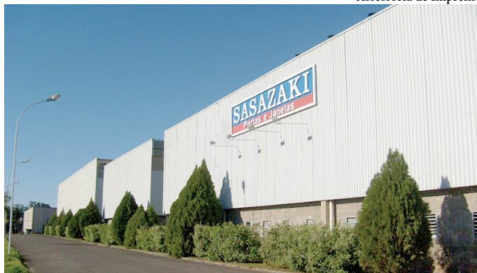
Vista da Sasazaki, empresa que é uma das líderes no segmento de portas e janelas

Inicialmente, o encontro ocorreria na semana passada, quando expirou o prazo de 15 dias dado pela empresa. “A reunião que ocorrerá no dia 7 de novembro [hoje] faz parte do