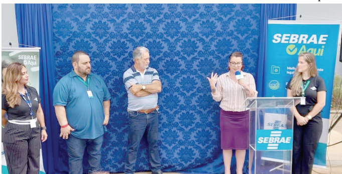
Representantes do Executivo de Ocaçu e do Sebrae durante inauguração de posto

Sebrae Aqui de Ocaçu já atende os empreendedores