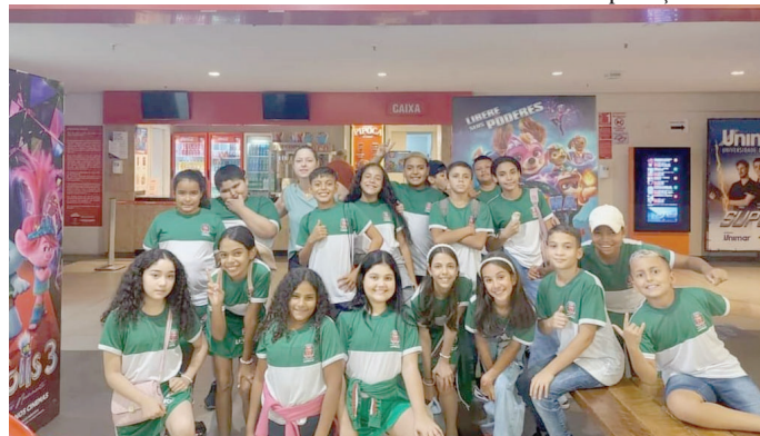
Alunos das escolas municipais de Lupércio e Santa Terezinha vão ao cinema em Marília

ra vez no cinema. É um projeto que envolve todas as crianças das Emefs [Escolas Municipais de Ensino Fundamental]. Em comemoração ao mês das crianças,