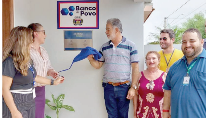
Inauguração do Sebrae Aqui de Ocaçu aconteceu no último dia 31 de outubro

Conforme a gerente regional do Sebrae-SP, Cristiane Regina, o posto de atendimento vai funcionar de segunda a sexta feira, das 8h às 11h30 e das 13h às 17h. Os interes-