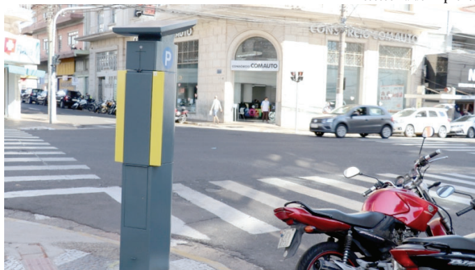
Parquímetro no Centro; testemunhas apontam falhas em equipamentos de empresa

Entre as penalidades apontadas pelo descumprimento contratual com a prefeitura, estão multa de 10% sobre o valor do contrato, atualizada pelo IGP-M, impedimento de licitar e contratar pelo prazo de um ano e possibilidade de rescisão da concessão se não houver manifestação da empresa