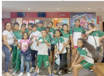
Crianças de Lupércio em cinema de Marília

Projeto contempla várias crianças com sessão de cinema P8