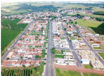
Vista aérea de Alvinlândia; boa colocação

Alvinlândia fica à frente de Lupércio em longevidade P4