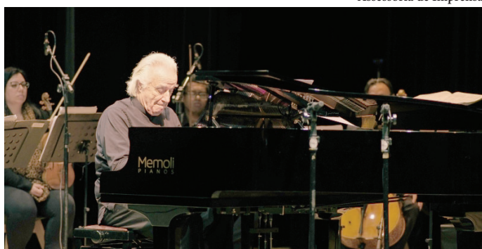
Maestro João Carlos Martins vai se apresentar no Teatro Municipal no dia 14