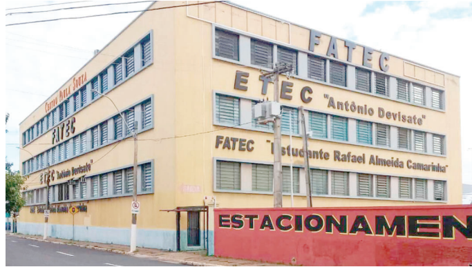
Inscrições para Vestibulinho foram prorrogadas para segunda-feira, dia 13 de novembro

Para o primeiro semestre de 2024, as Etecs oferecem 91.913 vagas para cursos técnicos, ensino médio integrado ao técnico, ensino médio em diferentes itinerários formativos, articulação da formação profissional média e superior, especializações técnicas e vagas remanescentes de segundo módulo.