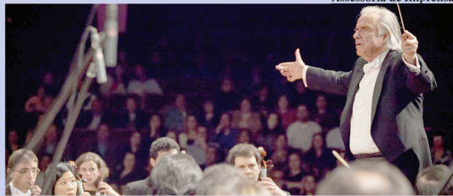
Maestro João Carlos Martins e Bachiana se apresentam dia 14 no Teatro Municipal