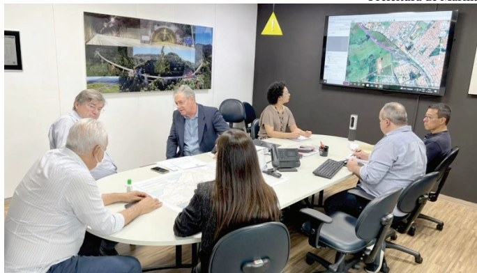
Prefeitura de Marília

O trecho para a implantação da via é o quilômetro 331 e 331