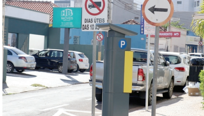
Parquímetro da gestora da Zona Azul; disputa com prefeitura ganha novo capítulo

Como publicado pelo O DIA, a portaria aplica diversas sanções à empresa, pois testemunhas confirmaram, ao longo do processo administrativo, falhas no cum-