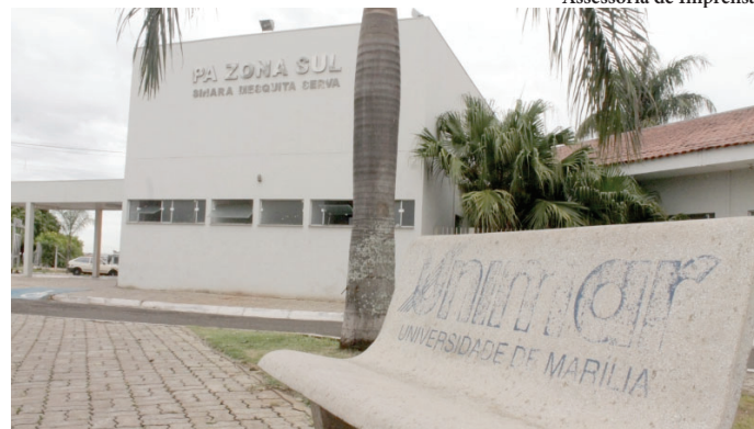
Fachada do PA; Comus quer saber como estão tratativas sobre dívidas com gestora

O Conselho ainda destaca a necessidade de a prefeitura infor-