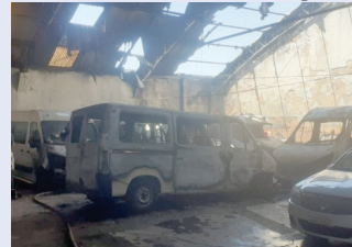
Veículos que foram queimados em incêndio