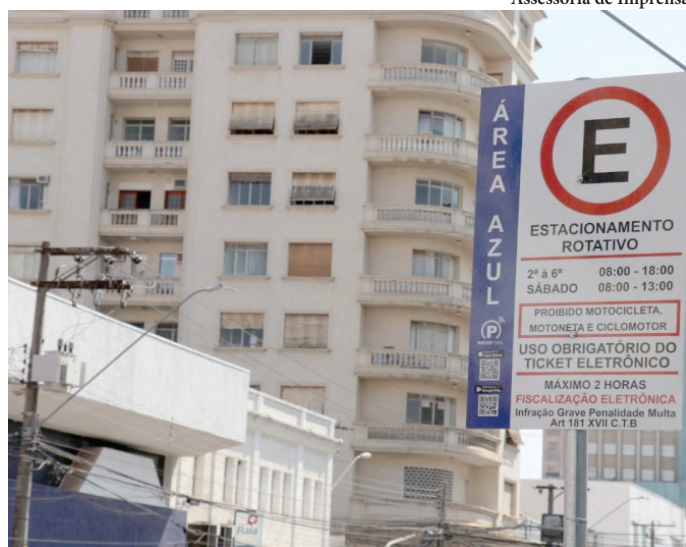
Placa do estacionamento rotativo da Zona Azul; impasse entre prefeitura e empresa