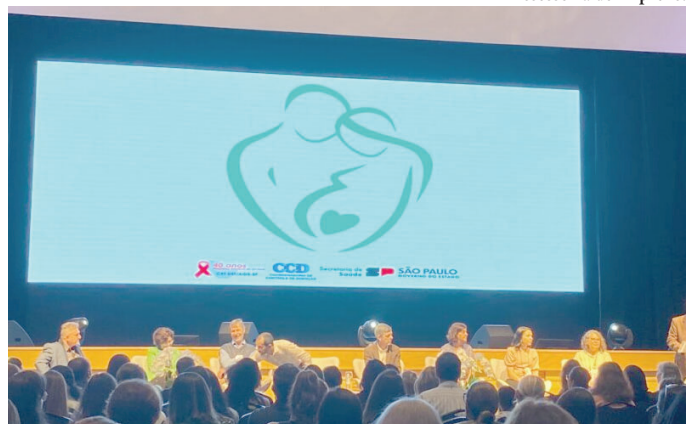
Semana Paulista de Mobilização ocorreu na Capital e Oriente foi um dos municípios premiados

Município é premiado na Capital durante ação da Semana Paulista de Mobilização Contra a Sífilis e Sífilis Congênita P7