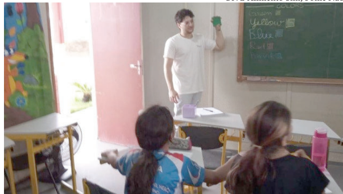
ONG Alimento Sim, Fome Não

Especialistas atestam que as crianças têm a capacidade de aprender um segundo idioma de forma mais natural e intuitiva quando expostas a ele desde cedo. Neurocientistas e especialistas em educação costumam comparar o cérebro a uma esponja e, por isso, aprender