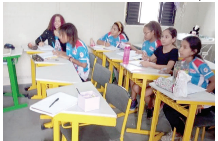
Crianças durante aula de inglês na sede de entidade que fica na região Norte