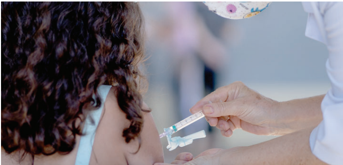
Criança recebe dose de vacina; Oriente continua com vacinação até durarem os estoques