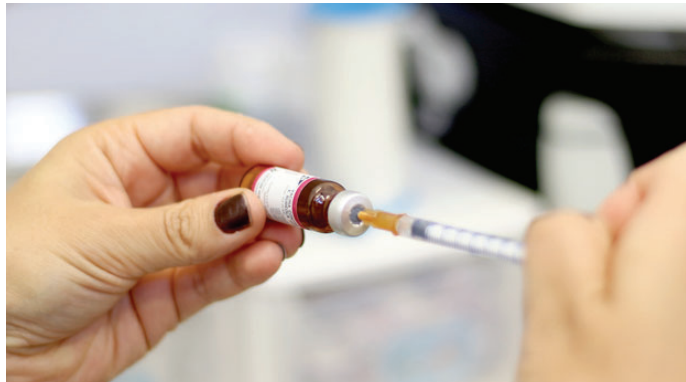
Profissional de saúde prepara dose de vacina; postos ainda aplicam imunizantes

responsáveis que estejam acompanhando as crianças e os adolescentes e também estão com doses em atraso, como da covid e Influenza, podem ser vacinados, caso haja