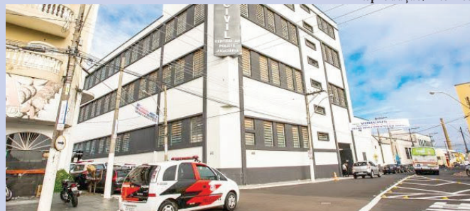
Fachada da CPJ, em Marília, onde condutor de veículo prestou depoimento no dia 30