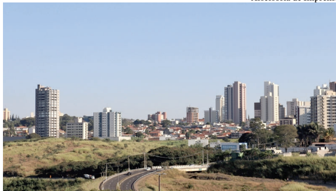
Vista de Marília; cidade tem saldo negativo em setembro, mas acumulado é bom

O setor que mais demitiu trabalhadores foi serviços, seguido pelo comércio. Construção civil e a indústria contrataram, com maior saldo para o primei-