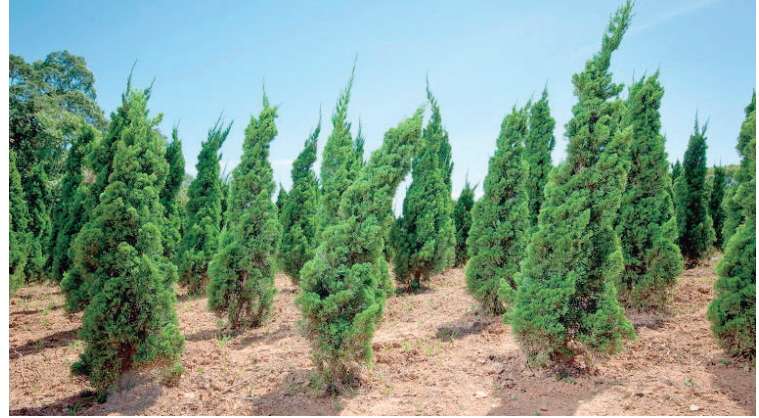
São 200 viveiros cadastrados e alguns vendem até 1,5 mil pinheiros no Natal

para representar a esperança durante o inverno. Mas foi em 1846 que a planta se tornou um símbolo maior desta época, graças à rainha Vitória, da Inglaterra. Tudo porque