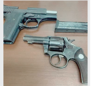
Dupla entregou armas usadas no crime

Ouvir é mais uma forma que temos para cuidar de você.