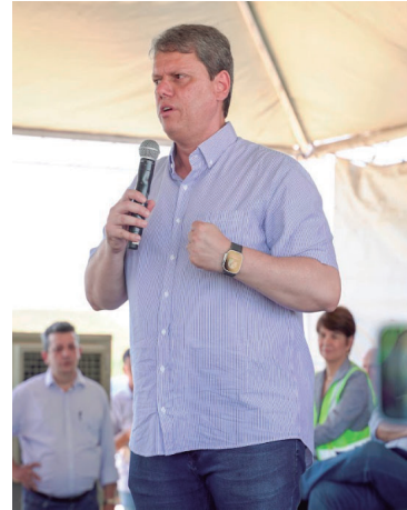
Governador discursa em entrega de obra

O PERIGO É PARA TODOS, O COMBATE TAMBÉM!