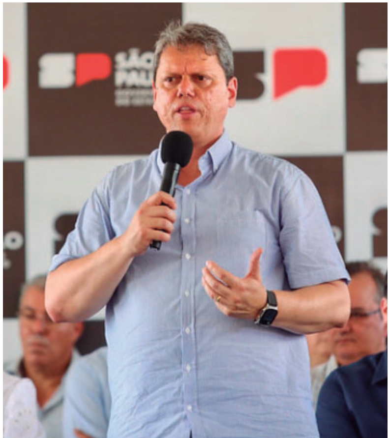
Tarcísio de Freitas esteve ontem (18) em Marília para entrega de duplicação da SP-333