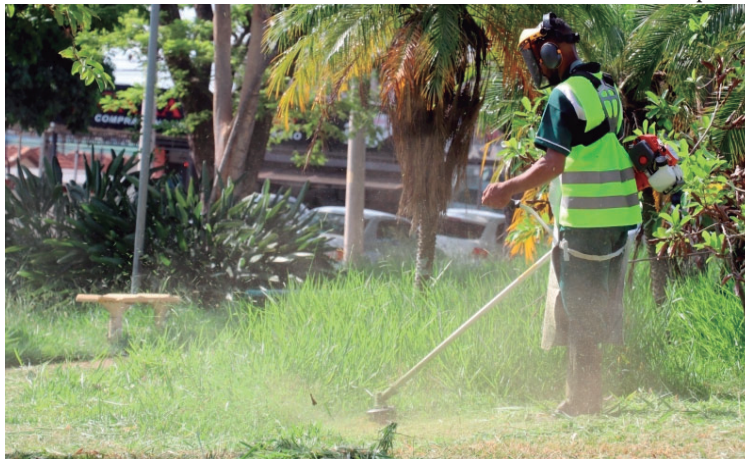
Assessoria de Imprensa

Segundo o município, o auxílio dos tratores nos trabalhos vai começar pela região Oeste,