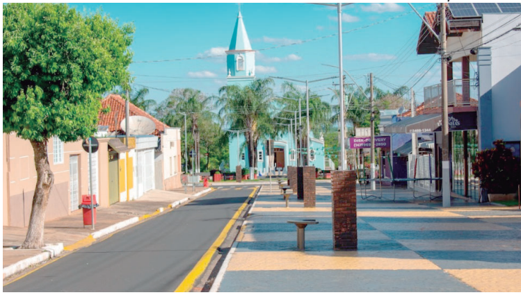
Calçada será palco de todas as apresentações do 'Quintana Verão', que começa no dia 23