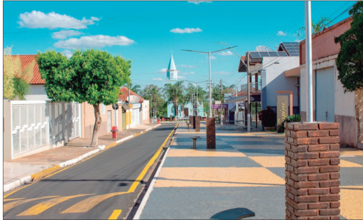
Vista do Calçadão de Quintana, onde todas as apresentações serão realizadas