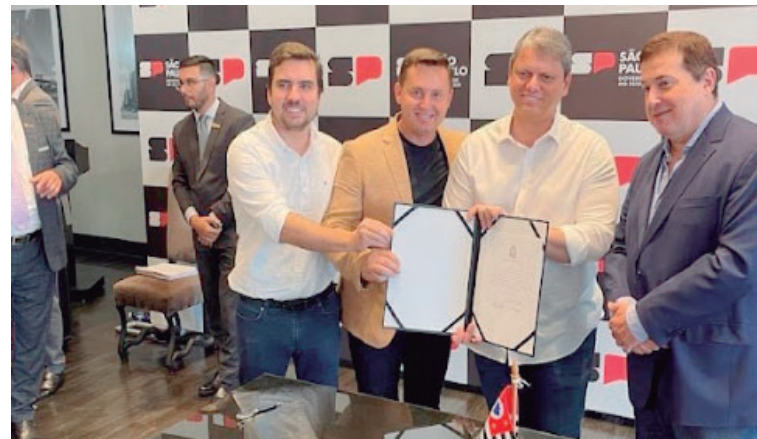
Prefeito assina liberação de recursos com governador Tarcísio e deputado Vinicius