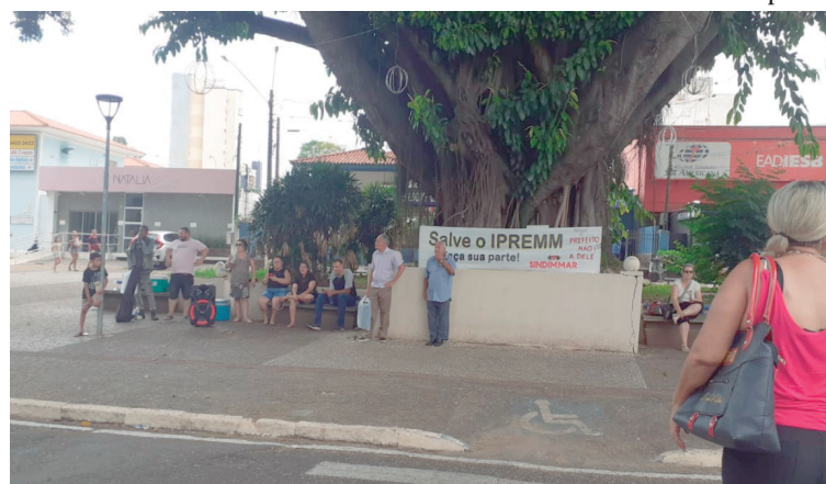
Início de protesto por pagamento em frente ao Paço Municipal na tarde de ontem