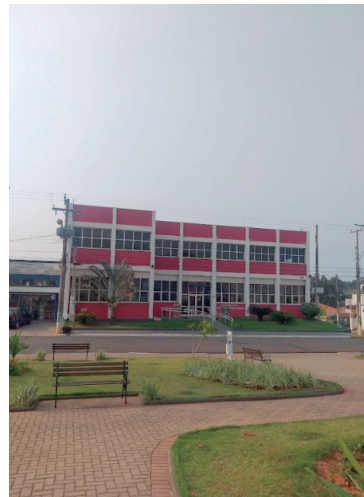
Adesão deve ser feita do Setor de Tributos