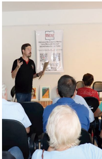
Formatura de alunos de curso digital