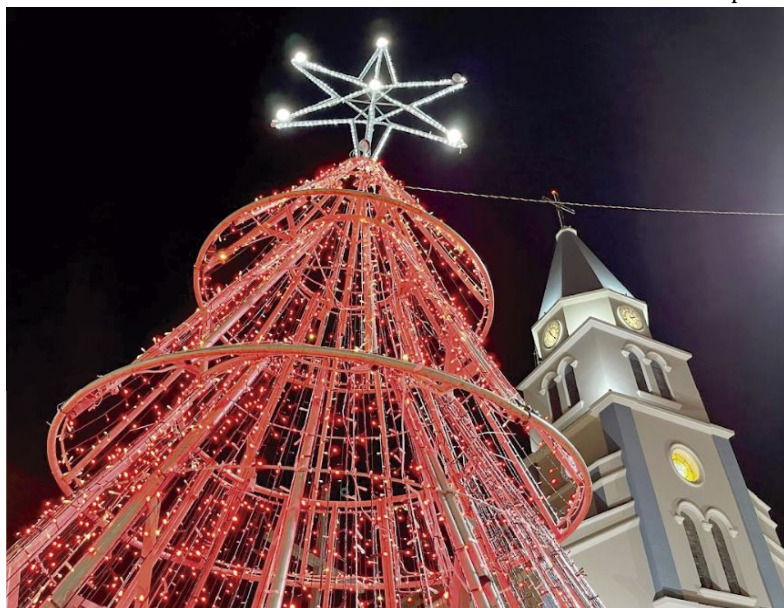
Árvore na praça da Matriz de Pompeia; iluminação também se estende às ruas do centro comercial