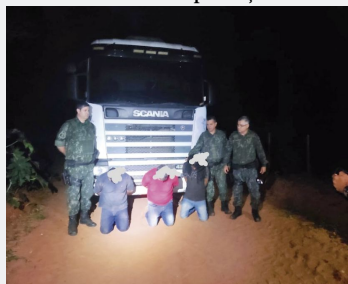
Trio foi preso em uma estrada rural