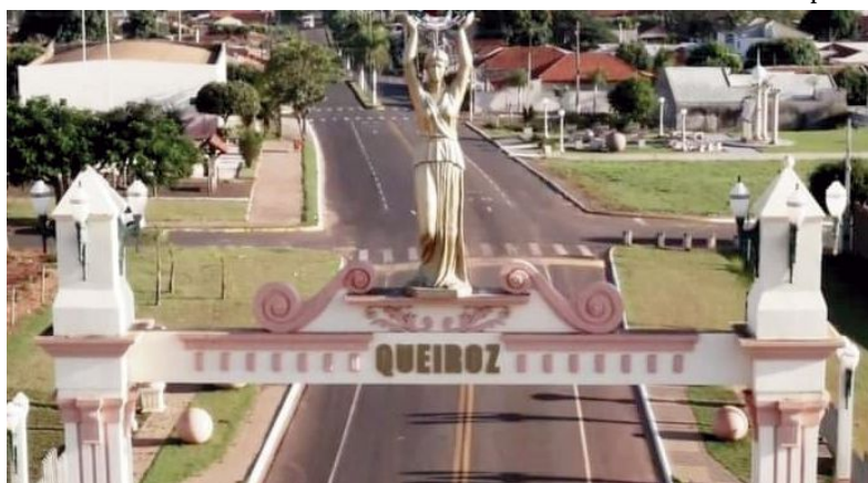
Vista da entrada de Queiroz; cidade tem projeto aprovado para receber recursos