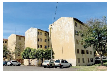
Imóveis correm risco de desabar na zona Sul