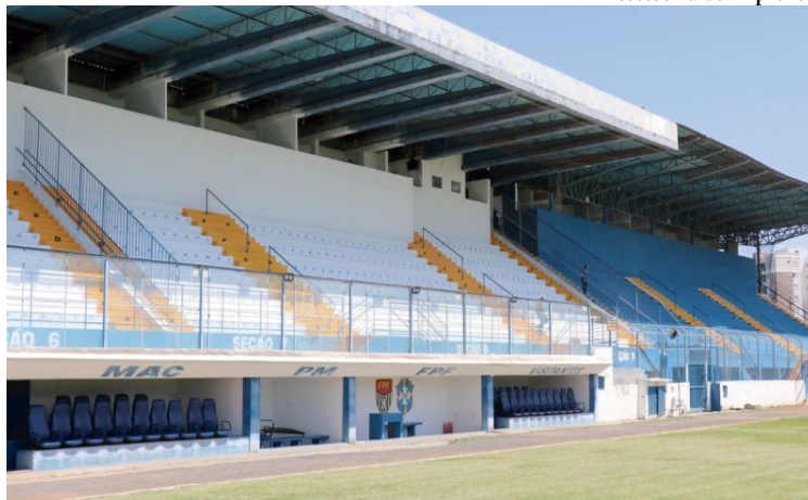
Vista do Abreução, onde jogos da Copa Paulista de Futebol Júnior serão realizados

O processo licitatório estipula que o pagamento será