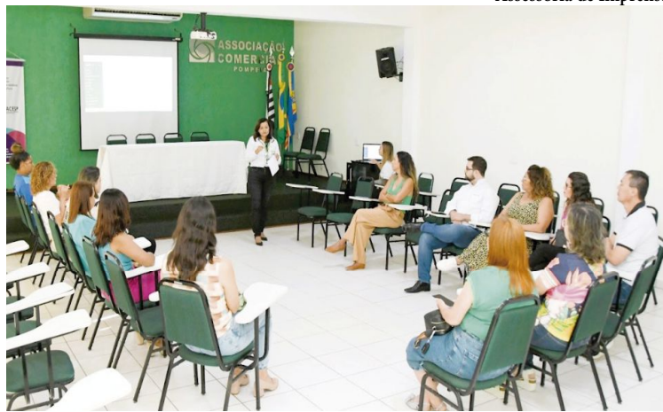
Assessoria de Imprensa

O primeiro sorteado receberá um vale-compra no valor de R$ 8 mil, enquanto o segundo será contemplado com R$ 5 mil. Serão outros R$ 3 mil para o terceiro sorteado e R$ 2 mil