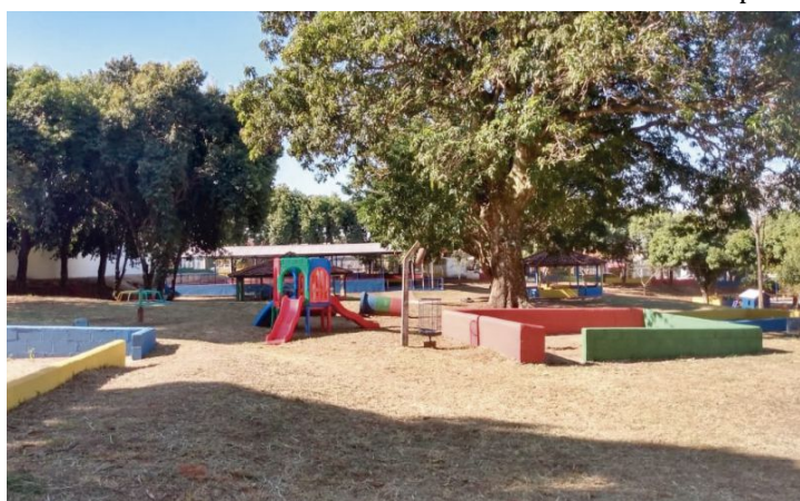
Área de recreação em escola de Marília; empresa é contratada para limpeza