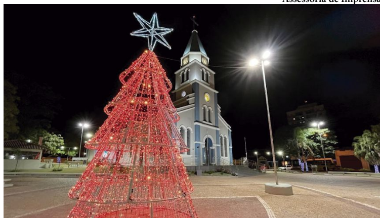
Vista da Matriz com a árvore vermelha; local é um dos mais visitados pelas famílias

SENAI / Alunos dos cursos de aprendizagem industrial, montador de máquinas e equipamentos industriais, soldador,