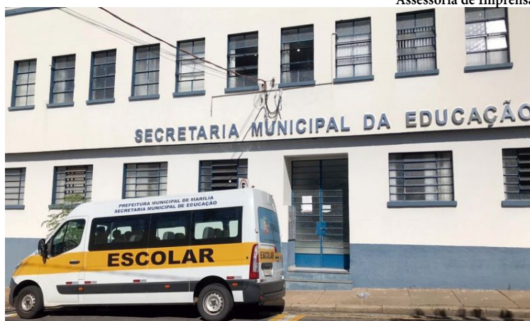
Assessoria de Imprensa

Na justificativa para a abertura do processo, a prefeitura destaca que “a contratação visa melhor atender ao interesse público, objetivando, sobretudo, o alcance de qualidade e eficiência, ao mesmo tempo em que se busca suprir as necessidades das unidades escolares e setores administrativos”. Inicialmente, no edital, o valor global do grupo informado era de R$ 25,2 milhões.