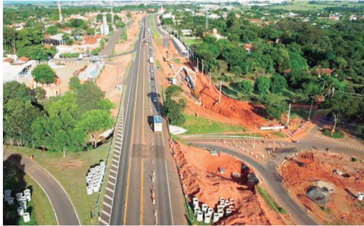
Obras na rodovia SP-294, em Marília, ficarão suspensas durante o fim de ano

A decisão de interromper as obras durante esta época busca proporcionar uma experiência mais tranquila para os motoristas que utilizarão a rodovia, já que