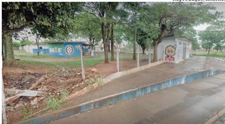
Poliesportivo antes do início da reforma; obras extrapolam o prazo de execução

informado para a conclusão das obras, após início das mesmas, era de 180 dias. Entre as melhorias executadas estão reforma do vestiário, cobertura, instalação de piso cimentado, de vidros, es-