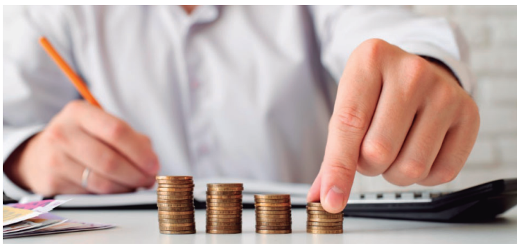
Consumidor conta moedas; marilienses pagam débitos, mas não cancelam protesto