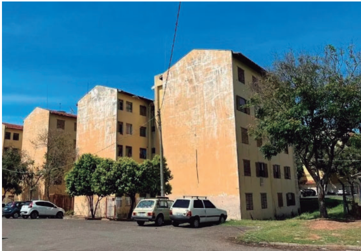
Vista dos prédios da CDHU; decisão obriga município a realizar desocupação