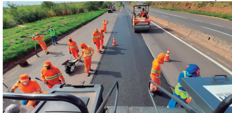
Funcionários de concessionária durante recuperação de pavimento na SP-294