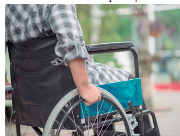
Censo quer dados de pessoas com deficiência

Levantamento do Censo Inclusivo tem sequência P6