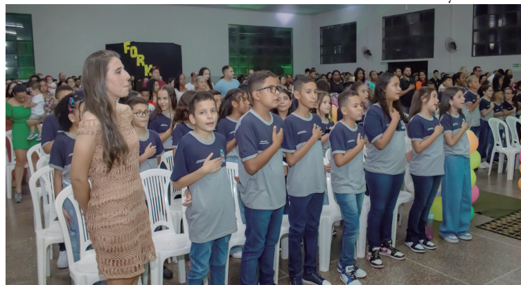
Cerimônia da formatura da Emef 'Pedro Sommerhauzer' emocionou familiares