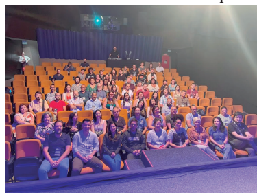
Encontro para renovação de parceria

Herculândia quer título de MIS para fomentar turismo P7