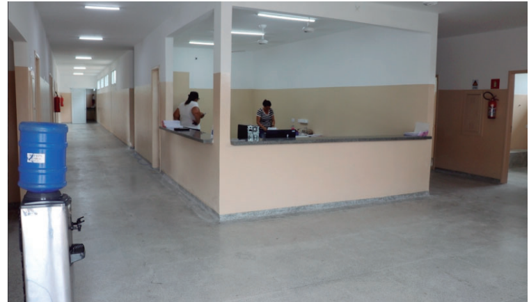
USF 'Roberto Mizobuchi', no Jardim Maracá; nova equipe atuará no bairro

Segundo o Ministério da Saúde, será feita a transferência