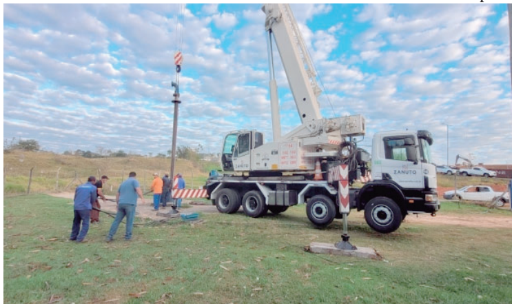
Servidores do Daem durante trabalho; processo de concessão é suspenso pela 2ª vez

Após três dias do aviso de interrupção no Diário Oficial de Marília, a prefeitura publicou ontem (11) o termo de suspensão da concorrência para a concessão do Daem (Departamento de Água e Esgoto de Marília), que teria sessão na próxima quinta-feira, dia 14. No documento, o município destaca que motivação para suspensão é "aparente desatendimento de alguns pontos da decisão proferida pelo Tribunal de Contas do Estado", que mandou retificar edital da concorrência para que a mesma fosse retomada.