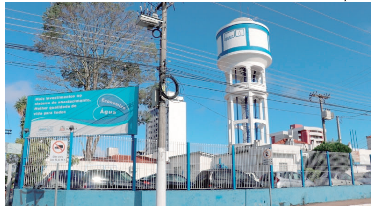
Daem está em processo de concessão e concorrência é suspensa pela segunda vez

Termo de suspensão da concessão do Daem é publicado e prefeitura assume que edital está em desacordo com determinações da Corte P2