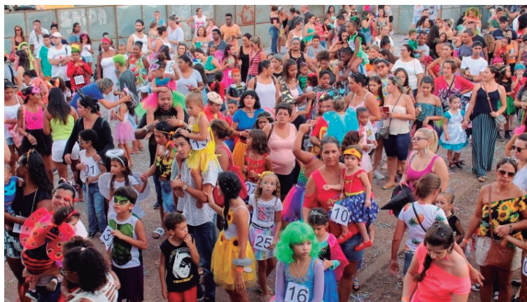
Foliões se divertem durante uma das festas mais populares do país; Marília terá carnaval popular

Programação do Carnaval 2024 ainda é definida, mas ginásio será palco da folia P5