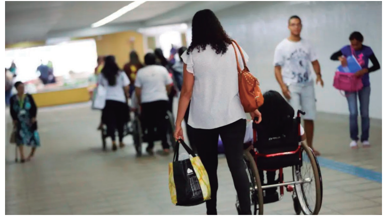
Cerca de 43% dos postos exclusivos a pessoas com deficiência estão desocupados

Valor da publicação: R$ 25,76 - Tiragem: 3,4 mil exemplares. Conforme Lei Municipal Nº 2.650, de 30 de março de 2016