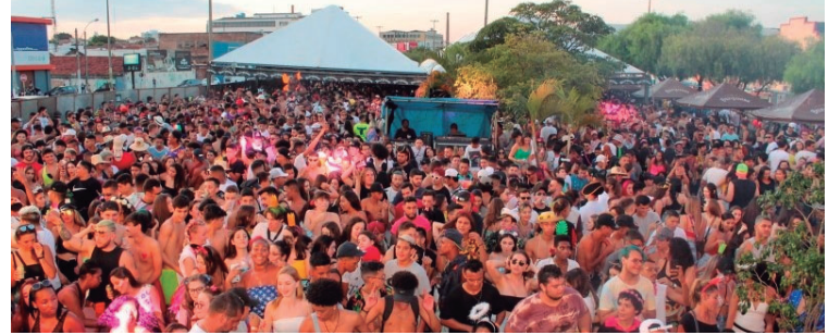
Foliões durante o Carnaval em 2023; Carna Salgueiro também será realizado em Marília