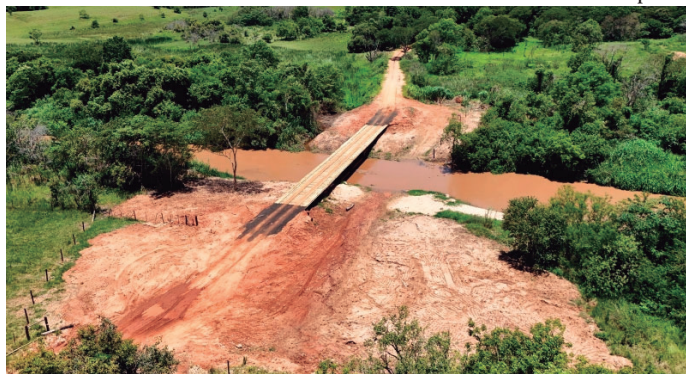
Vista da ponte de madeira recuperada em estrada que faz ligação entre Oriente e Marília