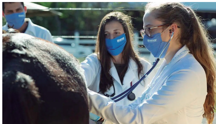
Aulas do Mestrado Profissional são quinzenais; programa tem duração total de dois anos

Mestrado Profissional em Saúde Animal da Unimar está com inscrições abertas P6