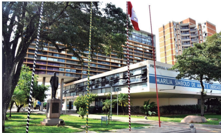
Administração municipal fica com a penúltima pior nota em avaliação sobre eficiência