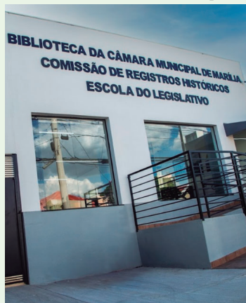
Biblioteca da Câmara; feira começa dia 22

Valor da publicação: R$ 25,76 - Tiragem: 3,4 mil exemplares. Conforme Lei Municipal Nº 2.650, de 30 de março de 2016