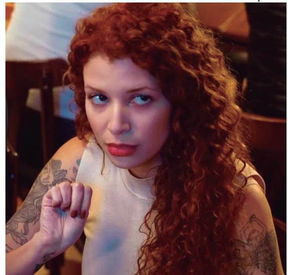
Jovem faz gesto do protocolo 'Não se Cale'; idosos também são destaque

Barraca para abrigar moradores de rua; número de pessoas nesta situação em Marília tem aumentado