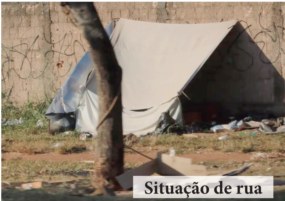
Situação de rua

Barraca para abrigar moradores de rua; número de pessoas nesta situação em Marília tem aumentado