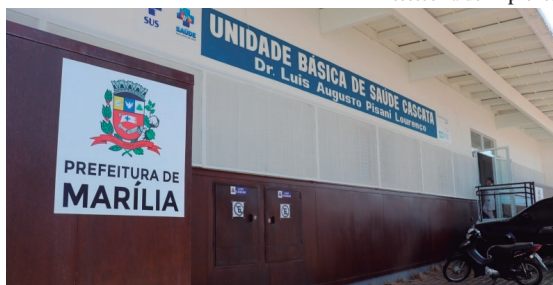
Posto de saúde da rede básica; vereador que diagnóstico rápido

Danilo da Saúde pede testagem rápida da dengue nos postos P4