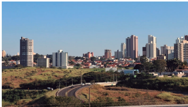
Vista de Marília; no ano passado, cidade apresentou redução do ritmo de abertura