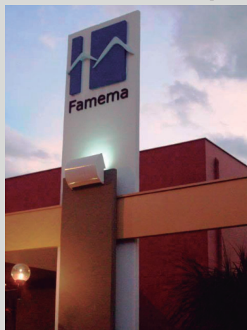
Famema, inaugurada no ano de 1966