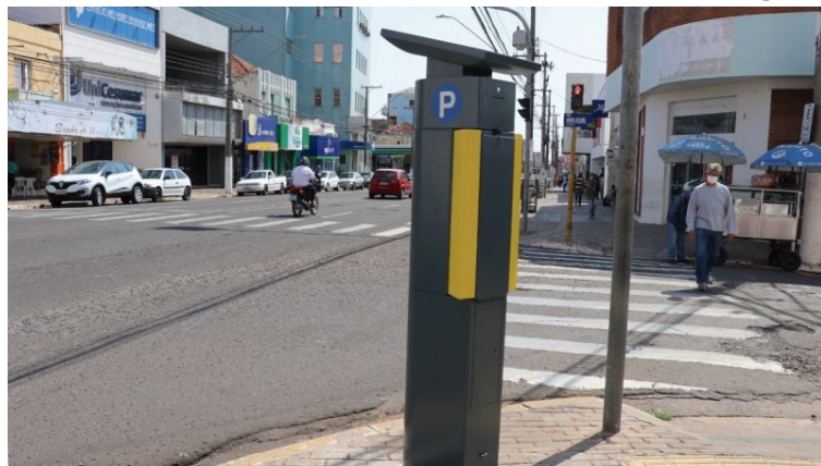
Parquímetros foram instalados na cidade pela Rizzo Parking em julho de 2021

Valor da publicação: R$ 51,52 - Tiragem: 3,4 mil exemplares. Conforme Lei Municipal Nº 2.650, de 30 de março de 2016