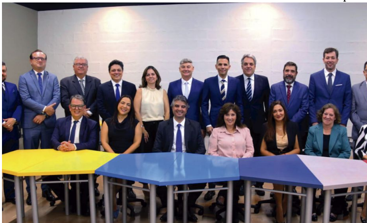
Assessoria de Imprensa

A Unimar está com edital aberto para o PPGD (Programa de Pós-Graduação em Direito). As inscrições para o processo seletivo do mestrado e doutorado ocorrem até 13 de março de 2024. Ao todo, 30 vagas são ofertadas, sendo 15 para o mestrado e 15 para o doutorado. Com área de concentração em Empreendimentos Econômicos, Desenvolvimento e Mudança Social, o PPGD Unimar destaca-se por sua abordagem inovadora, centrada na articulação entre Direito, desenvolvimento econômico e teorias das relações empresariais. O processo seletivo será 100% online, com inscrições exclusivamente pela internet, através do site ppgd.unimar.br , e envio