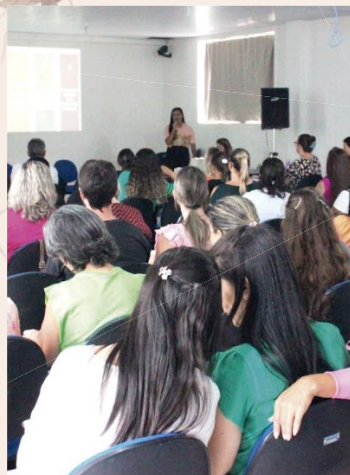
Capacitação foi realizada na terça

Valor da publicação: R$ 25,76 - Tiragem: 3,4 mil exemplares. Conforme Lei Municipal Nº 2.650, de 30 de março de 2016