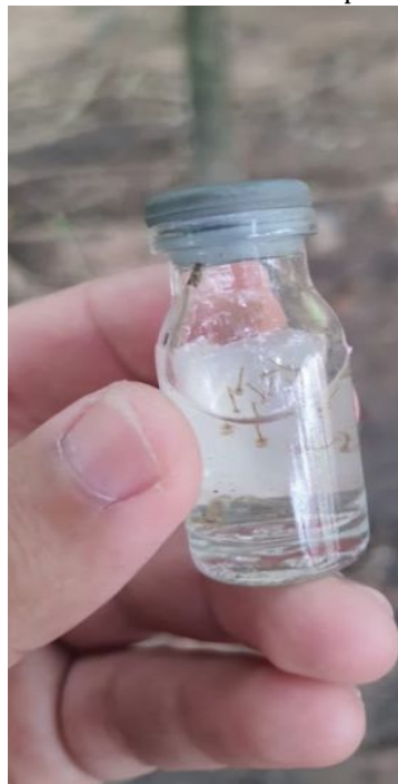
População deve ajudar no combate