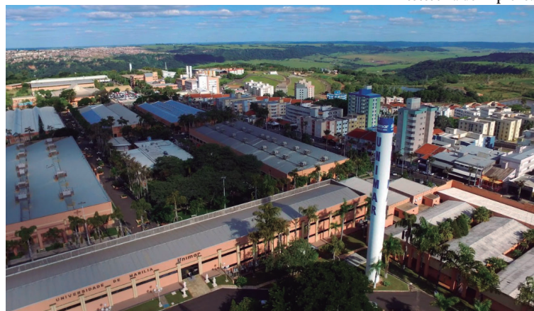
Unimar oferece curso de pós-graduação alinhado com as demandas do mercado