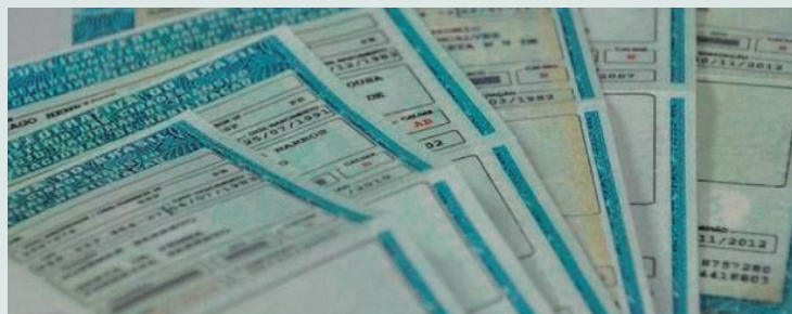
Novas taxas do Detran têm pagamento via modalidade Pix liberado pelo Estado