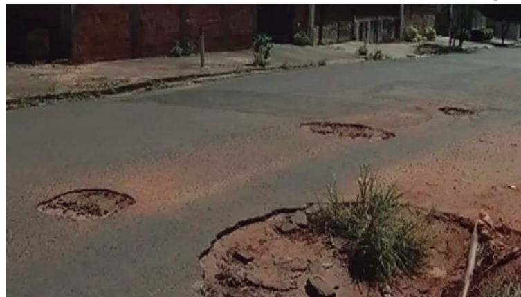
Marília assina convênio com Governo de São Paulo para receber verbas para o asfalto