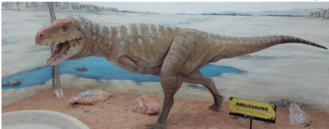
Réplica de dinossauro no Museu de Paleontologia; Marília quer fomentar turismo com novo Parque do Vale na zona Sul

No texto, está discriminado que uma parte do dinheiro, fixado em R$ 571.081,63, tem origem de convênio assinado com o Governo do Estado, enquanto o restante, cerca de R$ 25 mil, é de contrapartida do próprio município. O aporte está destinado à construção do parque, que ficará situado às margens da Via Expressa, entre