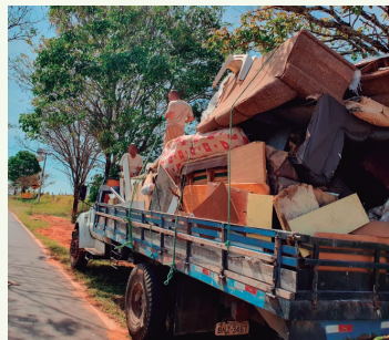
Ação atingiu diversos bairros da região