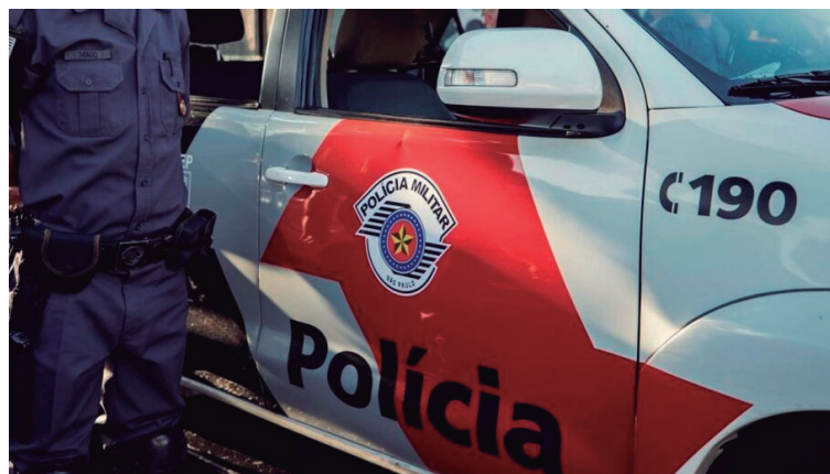
Policiais militares foram chamados e encontraram duas casas reviradas em fazenda