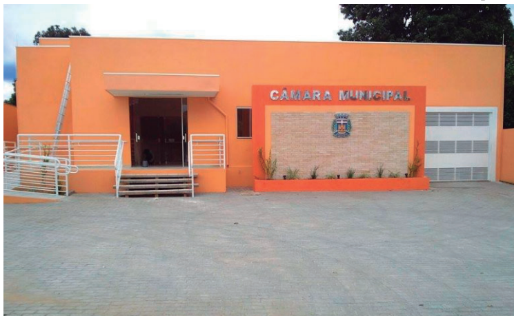
As despesas estão dentro do estabelecido pela Lei de Responsabilidade Fiscal

TRANSPARÊNCIA /O demonstrativo de despesa é especialmente importante no contexto governamental, onde a gestão transparente é fundamental. Por meio dele, é possível que órgãos e sociedade acompanhem o alocamento dos recursos. Também permite o controle fiscal, gestão orçamentária e financeira.