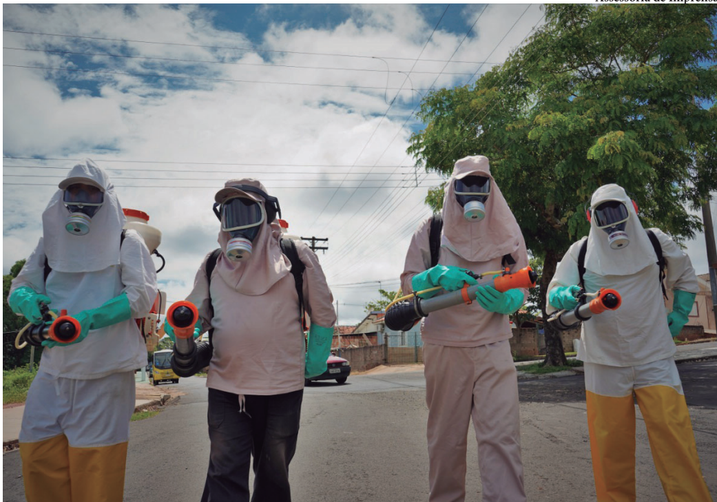
Agentes de saúde e endemias já percorrem os bairros Bandeirantes, Flândria, Centro e Jardins José Januário e Primavera

Ciclos de nebulização começam em Pompeia e moradores devem colaborar durante vistorias P5