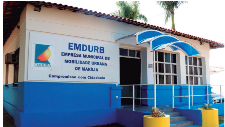
Emdurb afirma em nota que a não adesão se dá por incompatibilidade de sistema