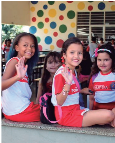
Padronização beneficiará transporte e merenda escolar