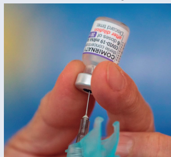
Doses da bivalente estão disponíveis

Valor da publicação: R$ 25,76 - Tiragem: 3,4 mil exemplares. Conforme Lei Municipal Nº 2.650, de 30 de março de 2016