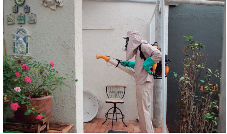
Agentes realizam visitas e ações de nebulização são promovidas em bairros da cidade

PREVENÇÃO /De acordo com o DHS (Departamento de Higiene e Saúde de Pompeia), o município está em constante alerta para evitar a proliferação do mosquito Aedes aegypti , através de ações em escolas, bloqueios epidemiológicos em áreas com focos positivos e casos da doença, bem como a realização do LIRAA (Levantamento Rápido do Índice de Infestação por Aedes aegypti ).