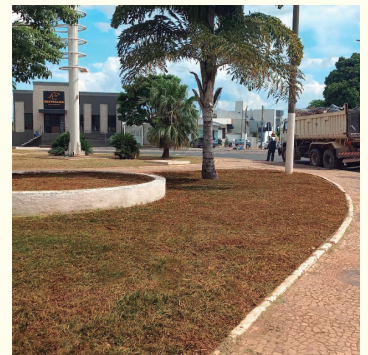
Praça recebeu capinação e limpeza