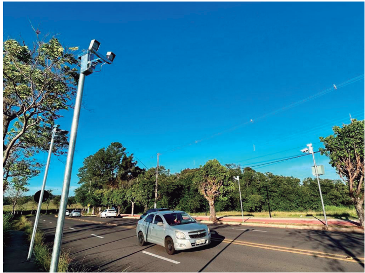
Empresa municipal de trânsito aponta "incompatibilidade sistêmica" como justificativa