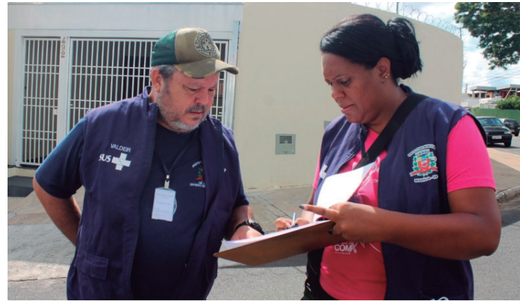
Município registra crescente preocupante na contabilização de casos confirmados

Valor da publicação: R$ 25,76 - Tiragem: 3,4 mil exemplares. Conforme Lei Municipal Nº 2.650, de 30 de março de 2016