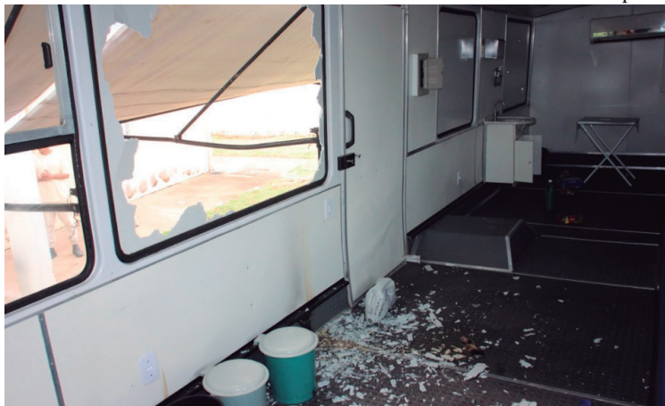
Interior da unidade móvel, que foi depredada pelos vândalos na madrugada de ontem

Eles quebraram vidros do veículo, causaram danos a sua estrutura e tentaram incendiá-lo. No seu interior, foram deixados recipientes de álcool líquido, provavelmente usado na tentativa de atear