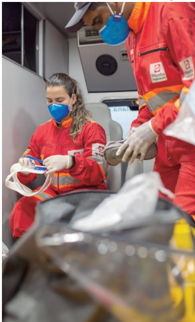
Funcionários de concessionária em atendimento