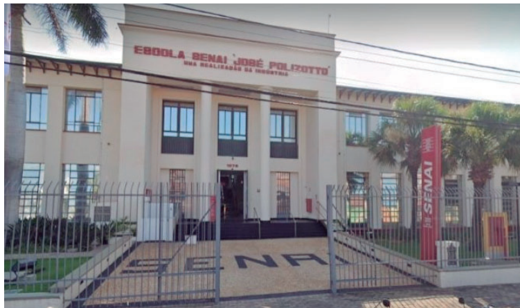
Escola do Senai em Marília, que fica localizada na avenida Sampaio Vidal

Com duração de seis a 40 horas, as capacitações são oferecidas na modalidade Massive Open Online Course, que é curso online aberto e massivo, nas áreas de inovação, tecnologia, linguagens e ciências humanas.