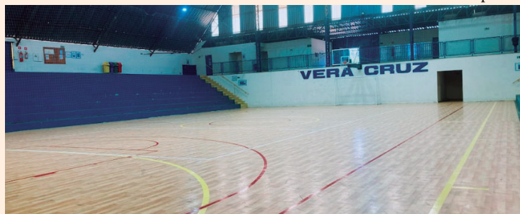
Ginásio de esportes será palco de competições que começam no próximo dia 15

FAÇA SUA PARTE. ELIMINE CRIADOUROS DO MOSQUITO AEDES AEGYPTI.