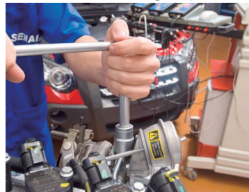
Mecânico é uma das opções de formação

Cursos de graça no Senai já inscrevem e aulas começam ainda este mês P3