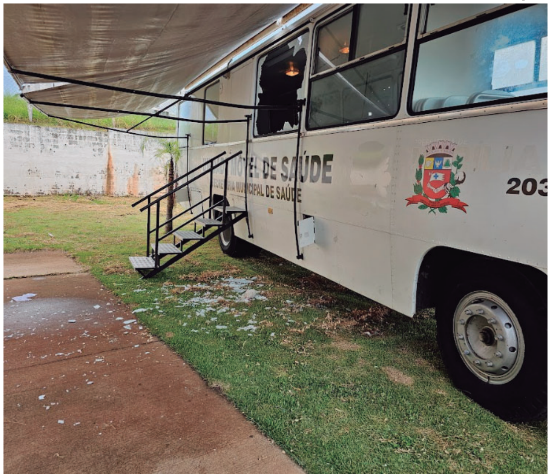
Veículo estava estacionado em USF da região Sul atingida por temporal e prestava atendimento à população; polícia já investiga o caso