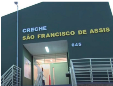
Creche de Vera Cruz; matrículas abertas

Vera Cruz define calendário e aulas serão retomadas no dia 5 de fevereiro P7