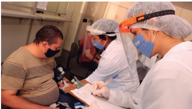
Pressão de paciente é aferida; inscrições podem ser realizadas até 16 de fevereiro