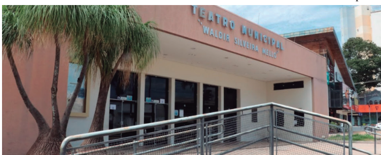
Teatro Municipal de Marília; resultado preliminar de edital para a Cultura é divulgado