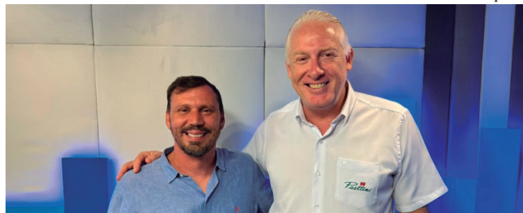
Sócio-proprietário do Moça de Jafa e proprietário do Pastini nos estúdios da Jovem Pan Marília

Projetos classificados da Lei Paulo Gustavo são divulgados pela Cultura P6