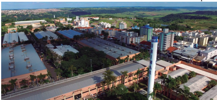
Vista da Unimar; instituição de ensino superior é uma das mais conceituadas do país