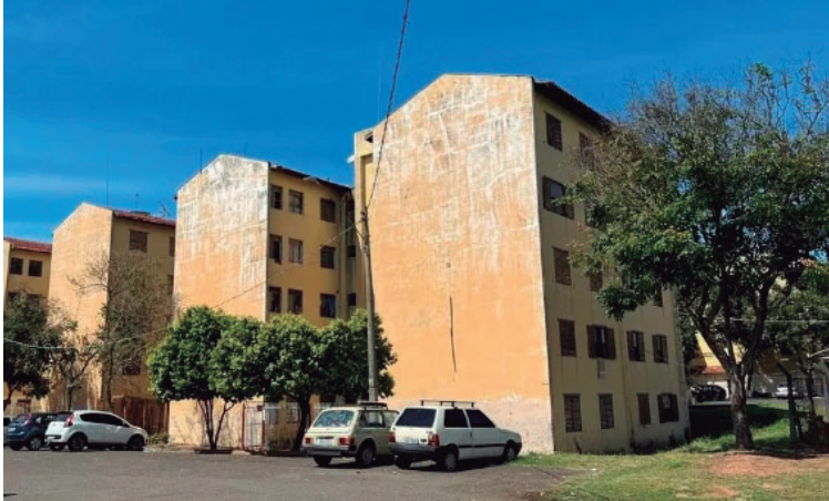
Prédios da CDHU na região Sul; perícia complementar mostra risco de desabamento