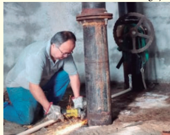
Serviços serão realizados neste domingo

Valor da publicação: R$ 25,76 - Tiragem: 3,4 mil exemplares. Conforme Lei Municipal Nº 2.650, de 30 de março de 2016