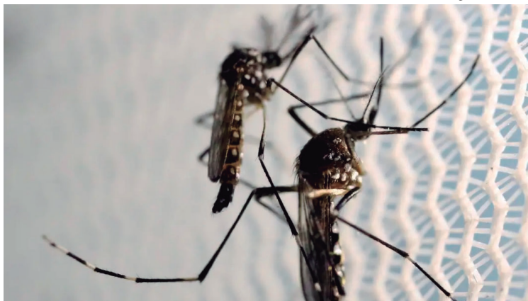
Marília tem quase mil casos confirmados de dengue e duas mortes; aumento é de 796%

CASOS /Segundo dados do Painel de Monitoramento da Dengue, do Centro de Operações de Emergências do governo de São Paulo, até o dia 15 de fevereiro, Marília tinha 993 casos confirmados da doença e duas mortes. Nos dois primeiros meses do ano passado foram 111 casos confirmados. As vítimas, que morreram em decorrência da doença, são dois idosos de 86 e 70 anos e, segundo a prefeitura, tinham comorbidades oriundas de doenças cardiovasculares e diabetes.