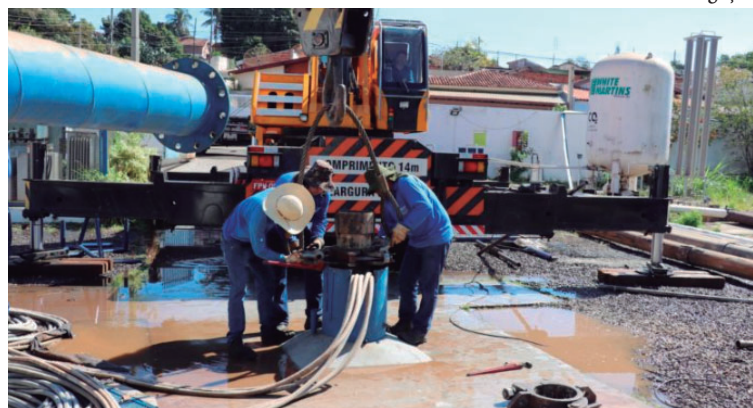
Duas novas ações foram protocoladas na Justiça de Marília para suspender edital