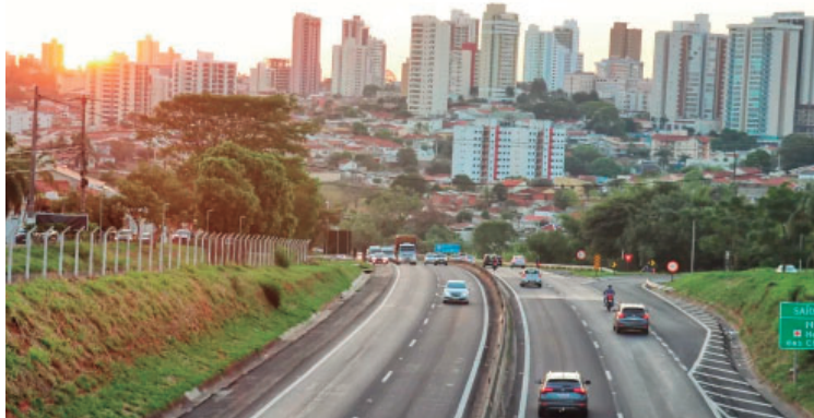
Contribuintes de Marília e região poderão parcelar os débitos em até 120 vezes

Com dívida de cerca de R$ 408 bilhões e mais de sete milhões de débitos inscritos na dívida ativa, o Governo de São