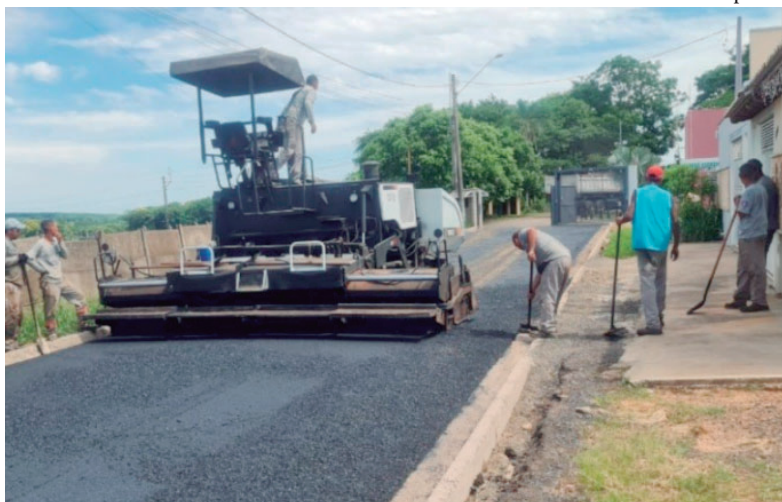
Pavimentações e recapeamento asfáltico são realizados desde dezembro do ano passado