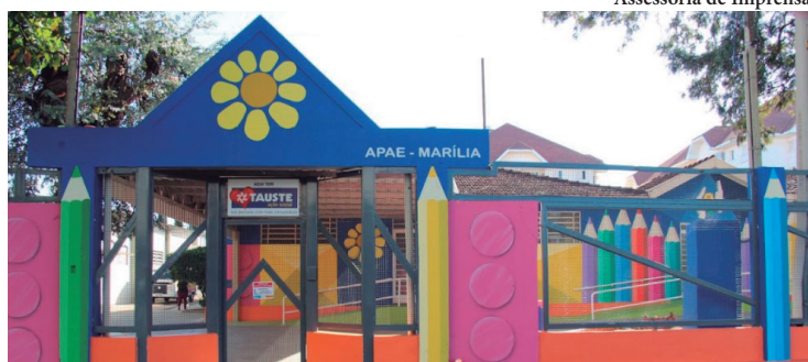
Apae de Marília está localizada no bairro Fragata, na região Sul, e já organiza evento