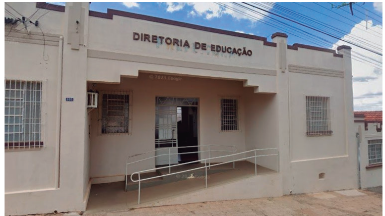
Vista da Apae, entidade que fica localizada na região Sul; bazar é realizado no Centro