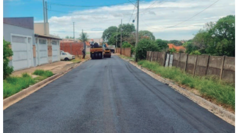
Nova infraestrutura já foi colocada em mais de 6.500 metros quadrados de vias

eto contempla aproximadamente 370 metros de galerias, com nove bueiros. "Quando chove aqui, é um verdadeiro caos e já perdemos tudo que você pode imaginar. É muito