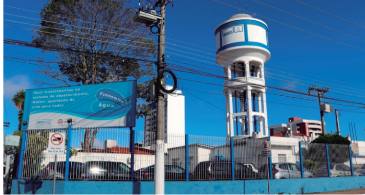
Documentos sobre concessão haviam sido solicitados em 18 de dezembro de 2023

“Como corretamente sustentado pelo ilustre Dr. Promotor de Justiça, [...] É direito dos indivíduos participarem efetivamente do processo de tomada de decisões