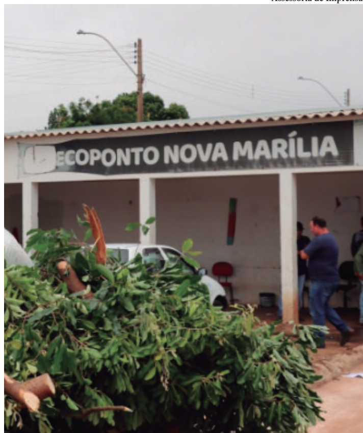
Local recebe cerca de 300 carregamentos todos os dias, incluindo finais de semana