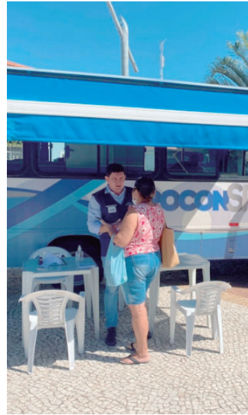
Atendimento será no bairro Bandeirantes