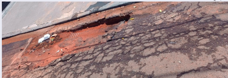
Buraco na rua José Rodrigues Pinar já tem três meses e reparo não é realizado