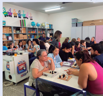
Formação foi realizada na zona Sul

Valor da publicação: R$ 25,76 - Tiragem: 3,4 mil exemplares. Conforme Lei Municipal Nº 2.650, de 30 de março de 2016