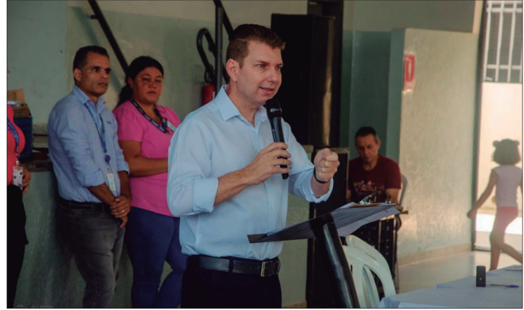
Prefeito Fernando Itapuã conversa com população em evento; ajuda às famílias

“São famílias de baixa renda, que mais precisam. Com as cestas que vamos distribuir, essas famílias terão uma Páscoa mais feliz, com comida na mesa. Elas [cestas] vão contar com arroz, feijão, óleo,