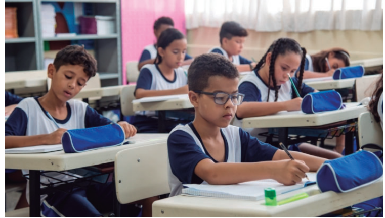
Alunos em escola municipal de Marília; valor do salário-educação chega a R$ 9,6 mi

estado, o repasse será no total de R$ 1,8 bilhões.