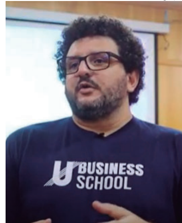
O evento reuniu novos alunos dos cursos