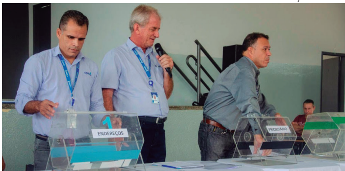
Sorteio foi realizado nos últimos dias e próximo passo será a entrega das moradias

Após sorteio de endereços, famílias vão receber moradias em Quintana