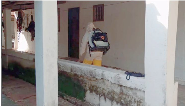
Queda é de 81% nos casos quando comparado aos dois primeiros meses do ano passado

Para conter o avanço da doença em Herculândia, e também em outros municípios do estado, será realizado na próxima sexta-feira (1º), o “Dia D de Mobilização Contra a Dengue”. O Governo de São Paulo divulgou que promoverá atividades especiais nas escolas, enquanto a Defesa Civil mobilizará as equipes para intensificar a orientação à população e reforçar as ações de combate ao mosquito nas residências. A Prefeitura de Herculândia ainda não detalhou como será o “Dia D” na cidade.