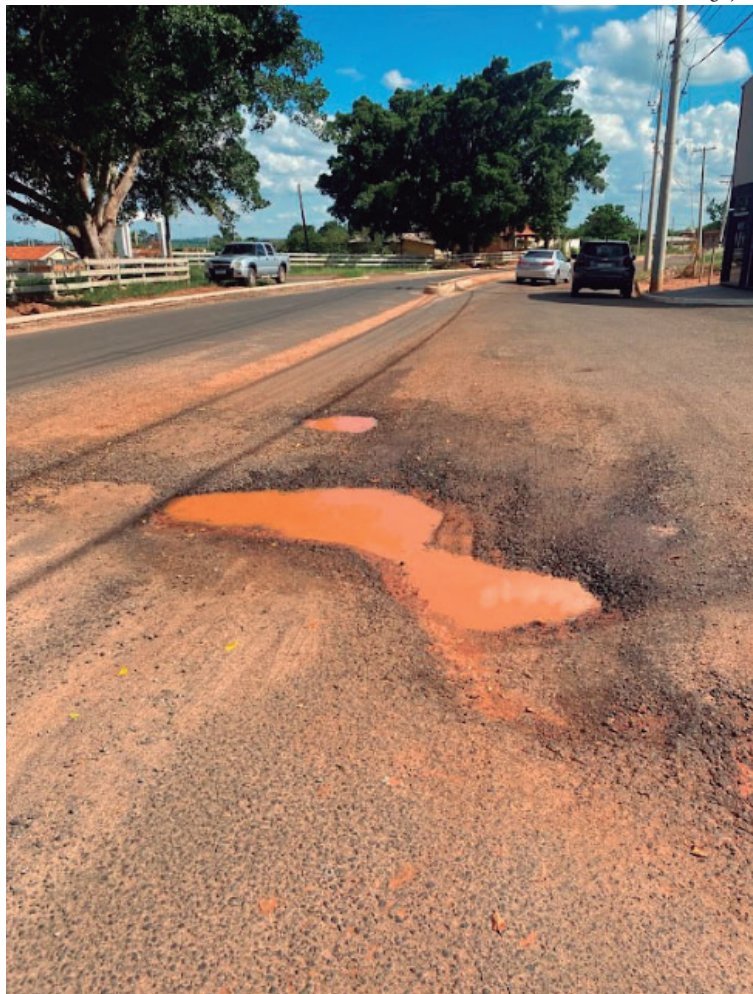
Grande quantidade de buracos e obra mal executada fazem parte das denúncias recebidas