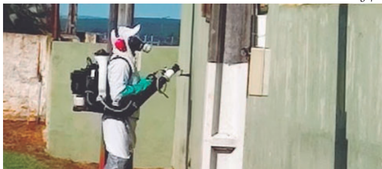
Trabalhos serão realizados das 8h às 13h; em seguida, ação deve seguir para Lupércio