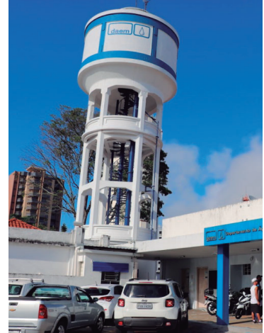
O certame segue com data definida