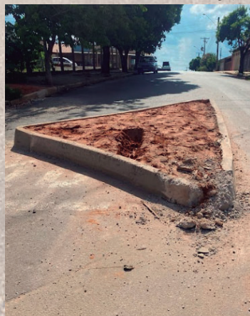
Canteiro recém-implantado em avenida