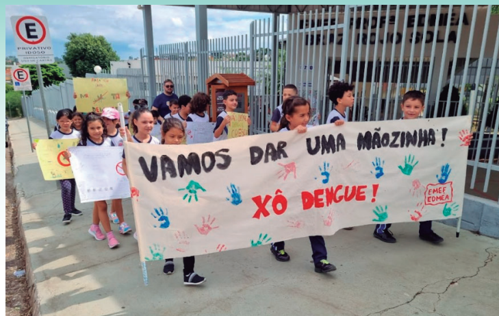
Passeata foi realizada com objetivo de sensibilizar moradores da zona Oeste de Marília