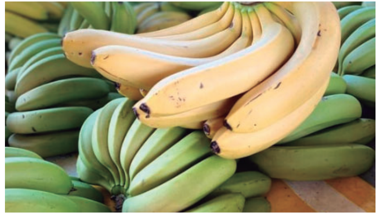
Lista contém diversos produtos, entre eles, mais de oito toneladas de banana nanica