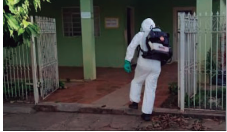
Trabalho de nebulização contra a dengue com equipamento costal já teve início

Em Lupércio, ainda conforme a gestora da Saúde, foram confirmados, também até o último dia 26, dois casos de dengue e cinco resultados de exames são aguardados. Ela chama a atenção para a importância da participação popular no combate à doença, como manter os ambientes livres de materiais que possam