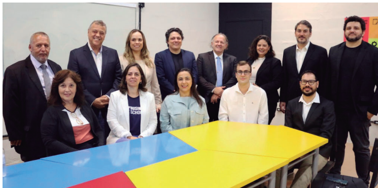
Hoje é o último dia para se inscrever no Mestrado Profissional em Administração