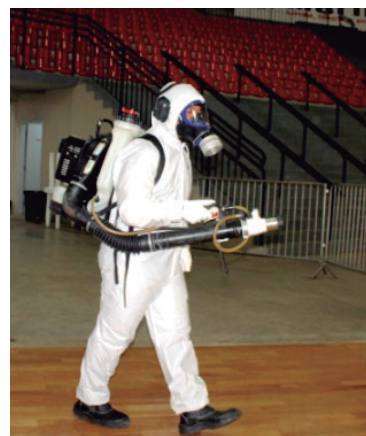
A cidade, agora, contabiliza 1.700 casos