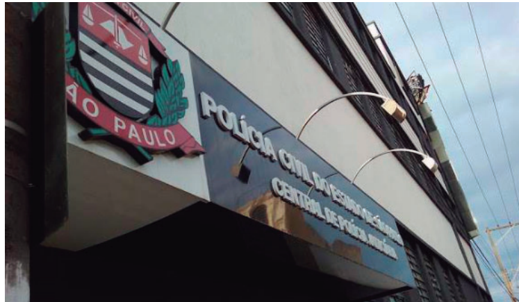
Ferramenta de proteção pode ser solicitada na DDM e também de forma online

os próprios direitos. “Temos um aumento de deferimentos de medidas protetivas porque a mulher lê, ouve ou assiste um caso e compara com o que existe com ela. A vítima percebe que se enquadra em uma situação de humilhação, ofensa ou agressão”, relata a delegada.