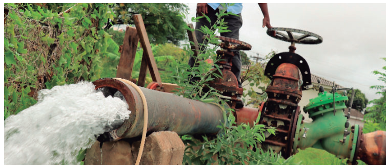
Já com a licitação suspensa, Prefeitura de Marília altera data de encerramento do edital

Suspensa pela Justiça de Marília no último dia 28 de fevereiro, a licitação que prevê a concessão do Daem ganha atualizações em processos judiciais e até modificação de prazo no edital P2