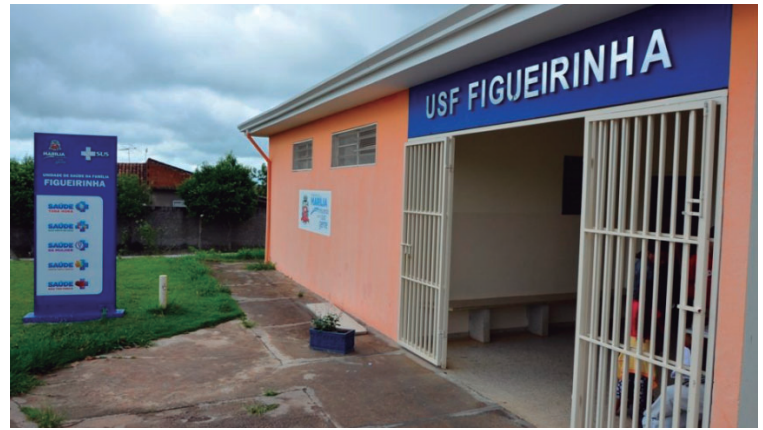
Vista de posto de saúde; Comus volta a cobrar melhorias nas unidades da rede básica

EM PERÍODO DE CHUVAS É PRECISO FICAR ATENTO!