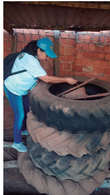
Agente durante fiscalização domiciliar