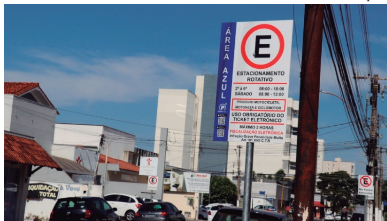
Rizzo volta a administrar estacionamento rotativo no centro da cidade de Marília