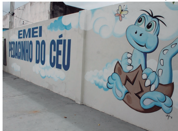
Emei 'Pedacinho do Céu' recebe alunos da Educação Infantil na zona Sul de Marília