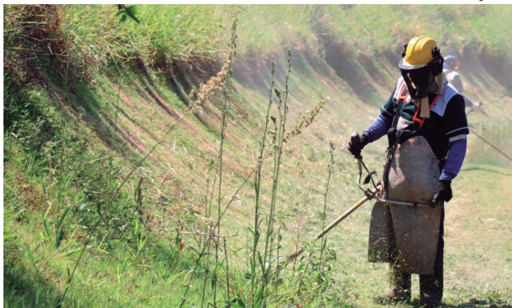
Além das vistorias de agentes, equipes também promovem capinação e limpeza

Como justificativas para a medida tomada estão o ressurgimento do sorotipo DENV3 da dengue, o período quente e chuvoso, o elevado número de notificações nas primeiras semanas epidemiológicas, além