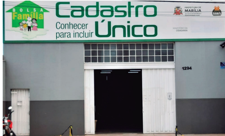
Secretaria de Assistência e Desenvolvimento Social de Marília faz alerta a beneficiários