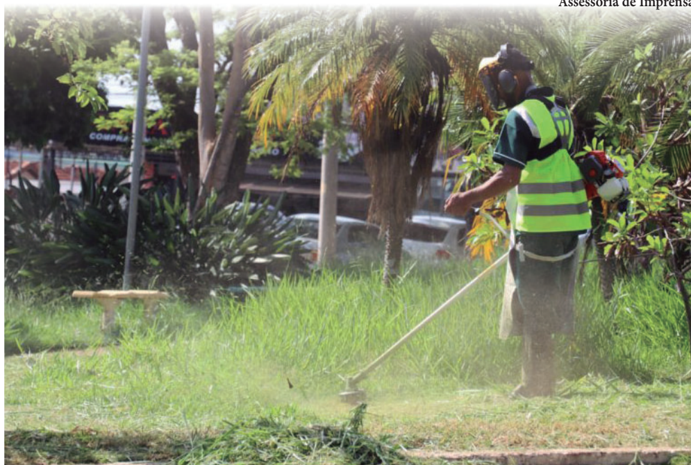
Por falta de manutenção em terrenos, outras 115 multas foram aplicadas em pouco mais de um mês na cidade