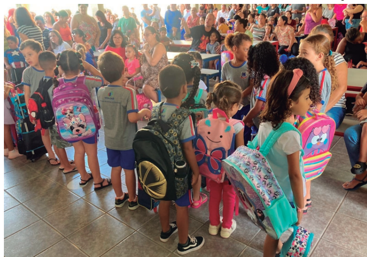
Prefeitura destaca ambiente educacional inclusivo, com suporte necessário aos alunos