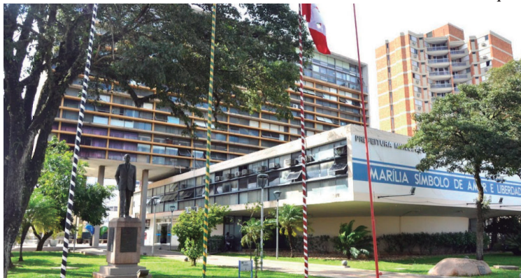
MPF apura gastos cometidos pela Prefeitura em combate à pandemia de Covid-19

Em um ofício endereçado ao tribunal, o MPF requer