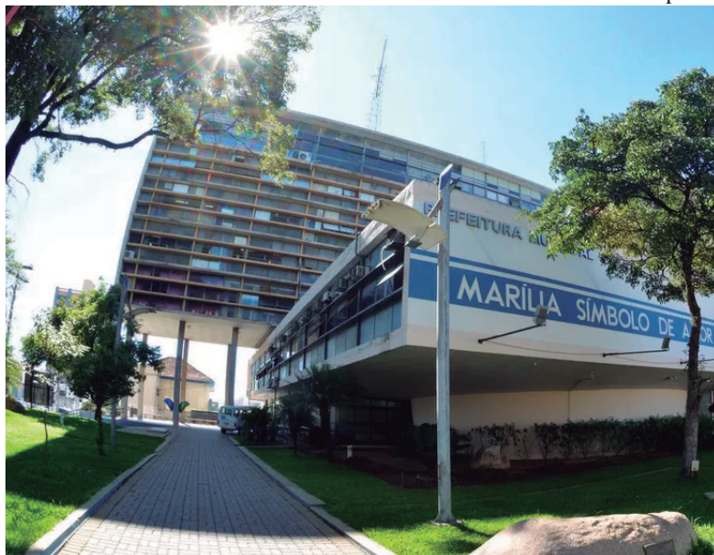
Verbas destinadas ao enfrentamento da pandemia na cidade devem ser analisadas