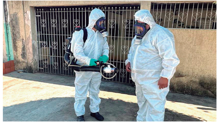
Até o início de fevereiro, a cidade registrava 635 casos confirmados e dois óbitos