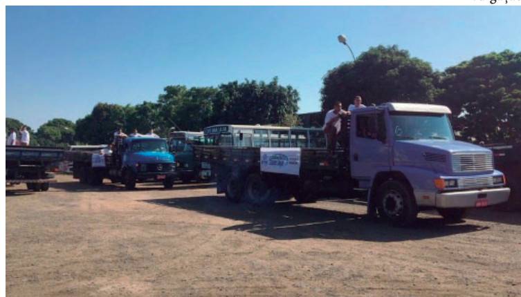
Vereador solicita que prefeitura realize ação conhecida como Semana da Faxina

Valor da publicação: R$ 252,00 - Tiragem: 3,4 mil exemplares. Conforme Lei Municipal Nº 2.650, de 30 de março de 2016