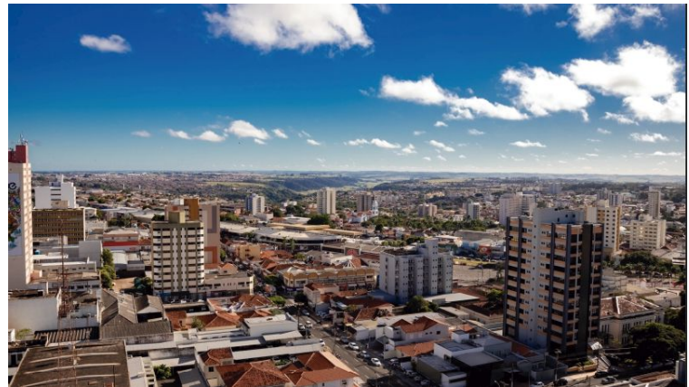
Cidade fecha o ano de 2023 no azul; contratações superam desligamentos