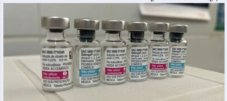
Novo estudo demonstra alta eficácia da vacina contra a dengue do Butantan