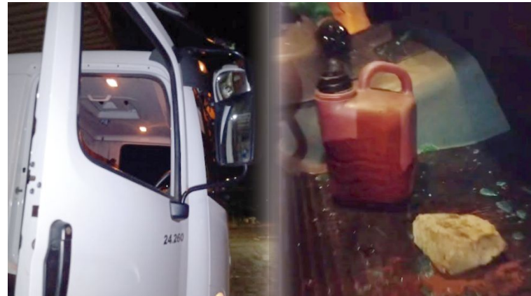
Pedra atingiu caminhão de empresa terceirizada que presta serviços ao município