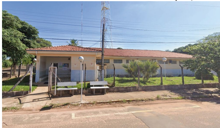
Unidade foi inaugurada há 20 anos e justificativa diz que o prédio apresenta problemas

relata ainda que a USF de Rosália foi construída e inaugurada em 2004 e que atende uma população estimada em 2.100 pessoas, com consultas médicas, odontológicas, coletas de