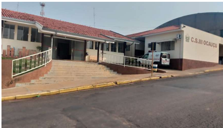
Centro de Saúde Augusto Destro tem doses contra a covid disponíveis à população