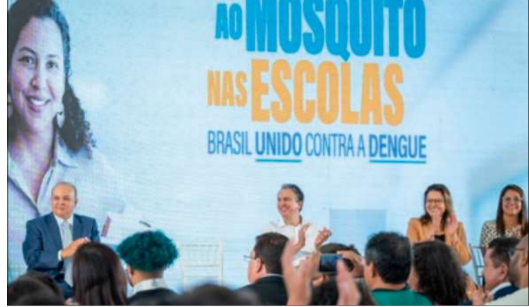
Combate à dengue pode ser financiado pelo Programa Dinheiro Direto Escola