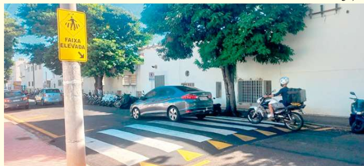
Dispositivos foram instalados em pontos próximos a escolas e unidades de saúde