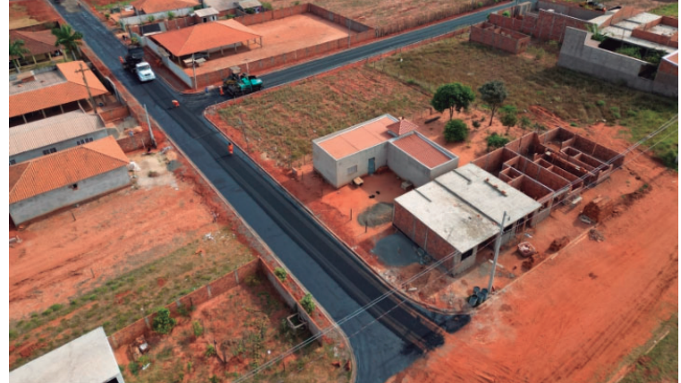
Quase 400 moradores do bairro Barretinho vão receber escrituras dos imóveis no dia 28

O programa é feito por convênio com os municípios e apoia tecnicamente todo o processo legal e burocrático, com abertu-