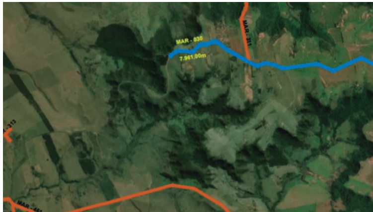
Imagem do projeto da ciclovia que consta no edital da licitação; obra de R$ 3,7 mi

e no caminho para o Mosteiro da Divina Misericórdia. Com uma faixa de separação da pista, o leito para o ciclismo terá largura de dois a três metros.