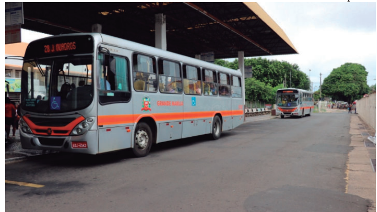
Segundo o relator, não foram apresentados requisitos legais que justifiquem a suspensão

Valor da publicação: R$ 26,88 - Tiragem: 3,4 mil exemplares. Conforme Lei Municipal Nº 2.650, de 30 de março de 2016