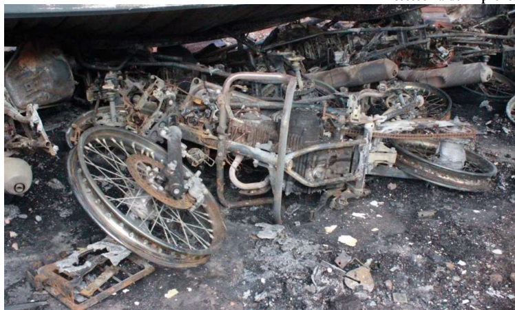
Diversas motocicletas e cerca de 60% do prédio foram consumidos pelas chamas

Em imagens compartilhadas nas redes sociais, o local aparece completamente tomado pelo fogo, que se alastrou rapidamente na construção localizada entre as ruas Quinze de Novembro e Sete de Setembro, no Centro. Moradores de prédios vizinhos registraram a