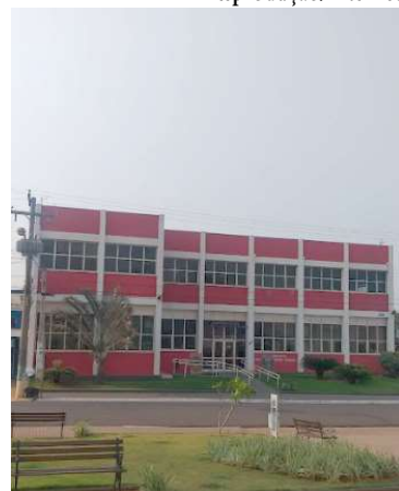
Vista da prefeitura; MP envia ofício