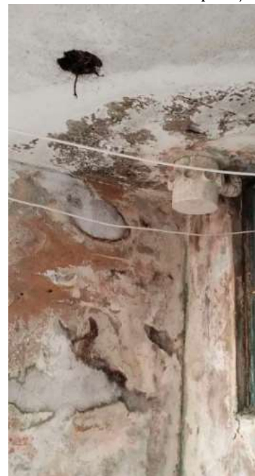
Registros demonstram o agravamento