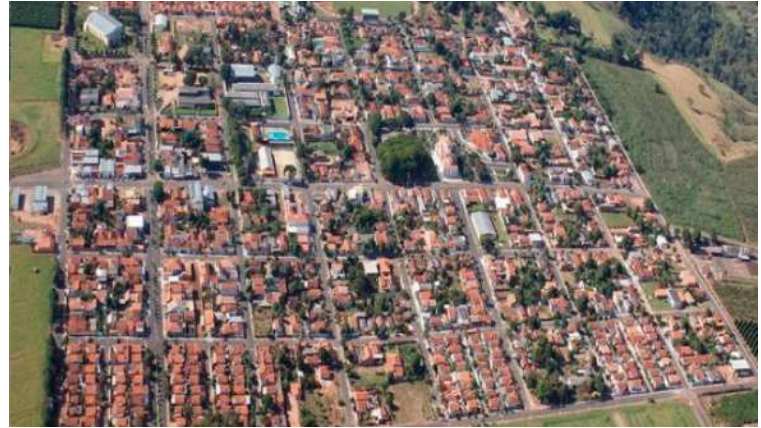
Vista de Lupércio; audiência pública debate Lei de Diretrizes Orçamentárias de 2025

Valor da publicação: R$ 26,88 - Tiragem: 3,4 mil exemplares. Conforme Lei Municipal Nº 2.650, de 30 de março de 2016