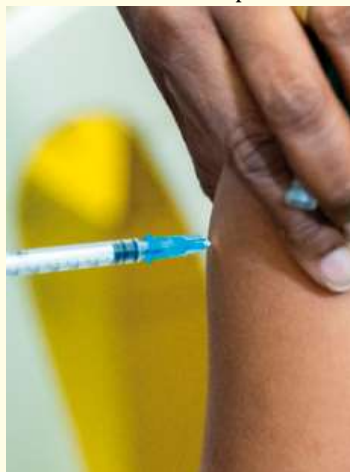
Dose de vacina contra a gripe é aplicada