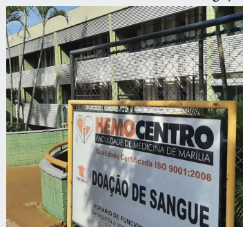
Hemocentro abre no dia 17 de março