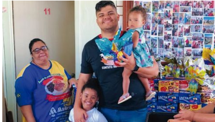
Diretor da ONG durante entrega de chocolates a crianças em edição do ano passado

Gonzaga explica que se as doações superarem a quantidade de crianças atendidas, a entrega será feita nos bairros. Na região Norte, a entrega dos chocolates vai ocorrer no dia 26 de março, também às 10h, na sede da entidade. É possível ainda fazer doações por meio do PIX, que é o CNPJ da ONG (26.313.280/0001-81).