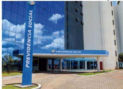
Lei aprovada no ano passado libera modalidade

Telemedicina começa a ser utilizada para perícias do INSS em caráter experimental, segundo Ministério P4