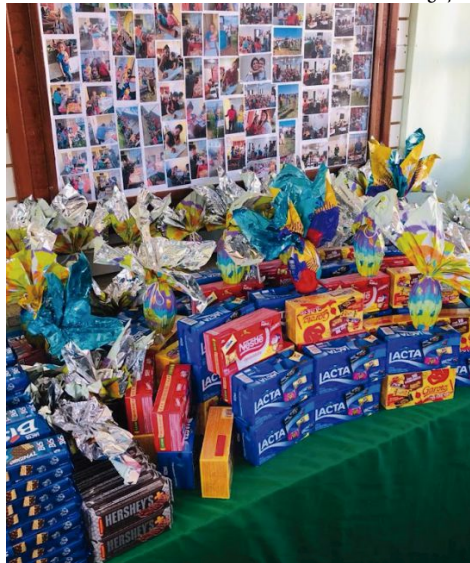
ONG já arrecada doces e chocolates para as crianças