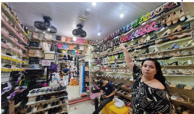
As obras no Camelódromo de Marília são necessárias para obtenção do AVCB

RESPOSTA /O posicionamento emitido pela prefeitura trata-se de uma resposta ao parecer dado por Sant'Ana, onde o promotor alega falta de "agilidade, responsabilidade e comprometimento [do município] com a solução do problema".