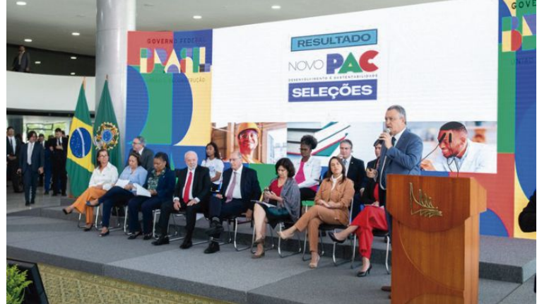
O anúncio da seleção foi realizado nesta quinta-feira no Palácio do Planalto

buscamos fazer justiça e equidade no tratamento dos municípios. Os critérios foram bem objetivos. Nós priorizamos municípios que não têm nenhuma creche sendo construída, por exemplo, para receber