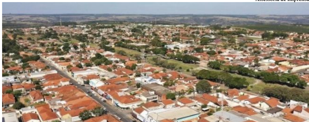
Produtores rurais precisam procurar o atendimento da administração municipal de segunda a sexta-feira, das 9h às 17h