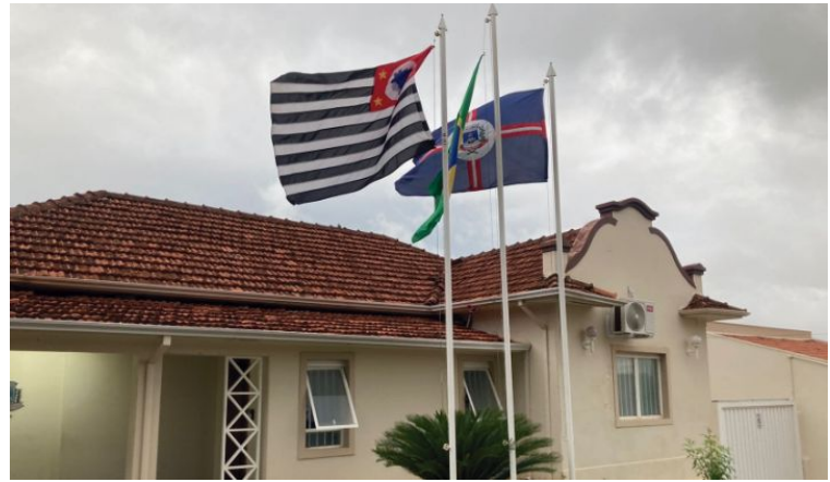
Produtores Rurais devem procurar a prefeitura para cadastrar a declaração da Dipam