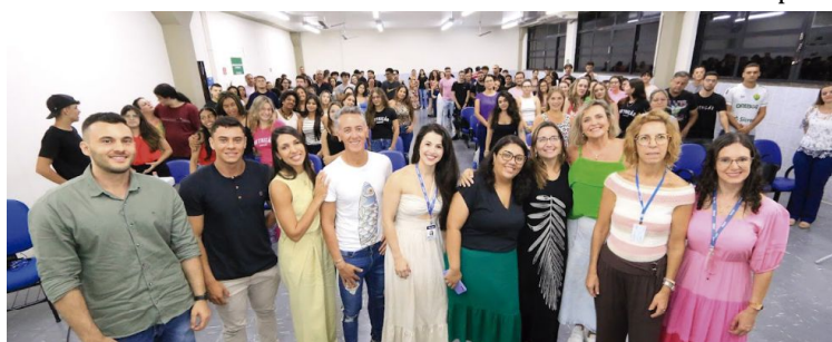
4ª edição do Nutrirede, da Unimar, recebeu ingressantes, familiares e egressos