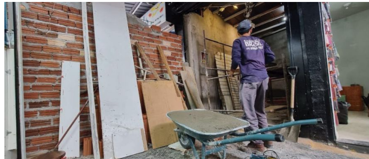
Ministério Público havia apontado descomprometimento e irresponsabilidade do Executivo