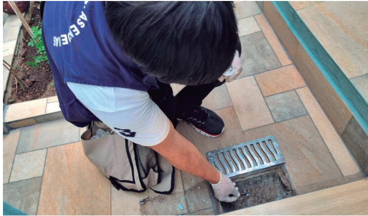
Agente usa larvicida em ralo; novo horário é 'cancelado' após pressão e queixas

tegoria para barrá-la. Segundo os servidores, o novo expediente iria prejudicá-los, já que muitos têm outras obrigações à noite, como estudo, trabalho extra para complementar renda e cuidados com filhos e parentes acamados.