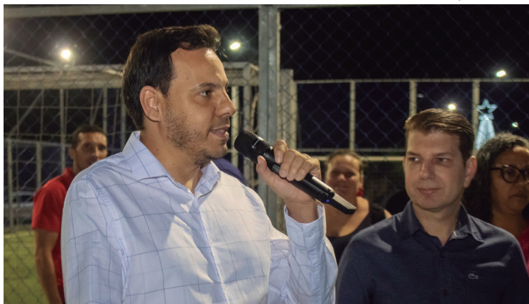
Secretário da Promoção Social é observado pelo prefeito Itapuã em edição anterior