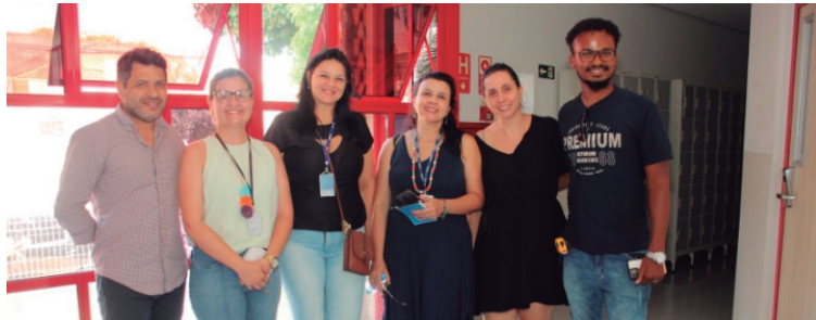
O público poderá desfrutar de diferentes produtos gastronômicos de origem local