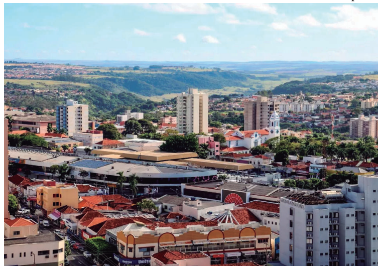
Os dois primeiros meses do ano indicam possibilidade de crescimento na cidade