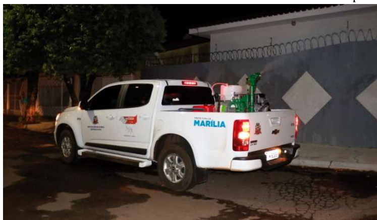
Zona Norte e Centro também seguem recebendo o serviço de nebulização

Renata, Jardim Santa Antonieta e Parque Residencial Julieta, na zona Norte, e Alto Cafezal, na região Central, também vêm recebendo o serviço, que visa frear o avanço da dengue no município.