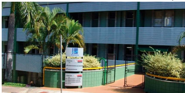
Hemocentro de Marília fica localizado na região Sul; abertura especial neste domingo