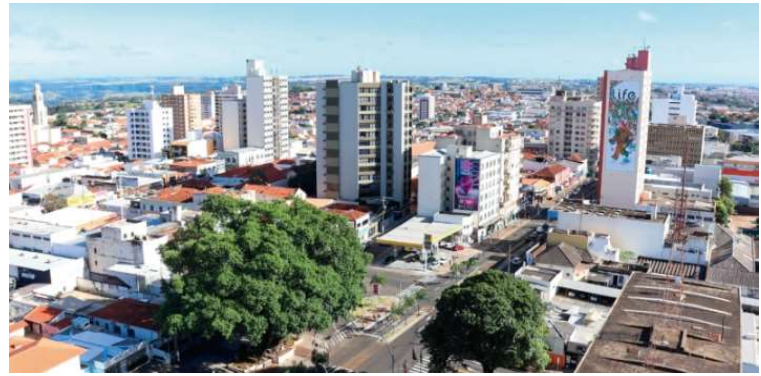
Vista de Marília, que caiu 27 posições em ranking, mas ainda está entre as 50 no país