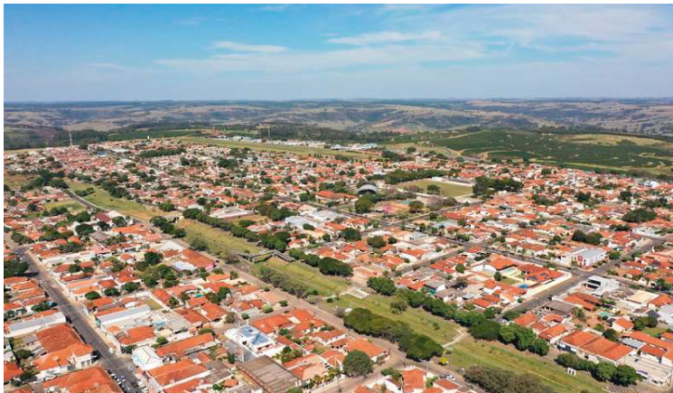
Programa de renegociação com o município termina no dia 30 e oferece descontos

O Programa de Recuperação Fiscal, aprovado na Câmara Mu-