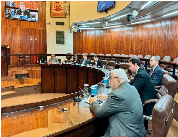
Denúncia contém diversos apontamentos de irregulares no Instituto de Previdência