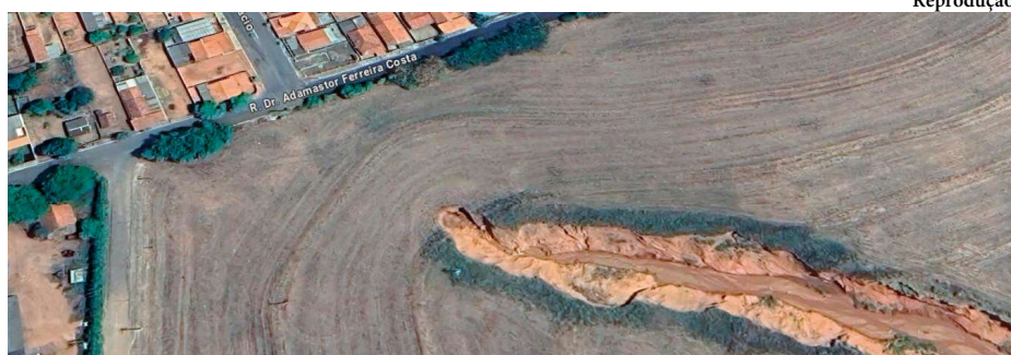
Imagem de satélite mostra dimensão da cratera formada na cidade de Lupércio e que se aproxima de casas