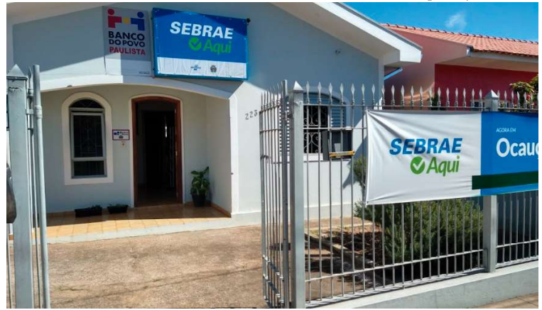
Posto do Sebrae Aqui de Ocaçu, onde as inscrições para o curso podem ser feitas