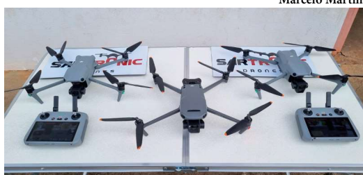
Serviço contra a dengue foi contratado por R$ 11,6 mil ao mês