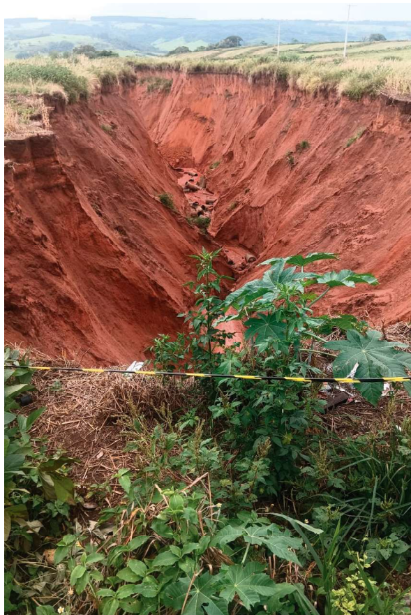
Registro de outro ângulo da mesma erosão; moradores reclamam