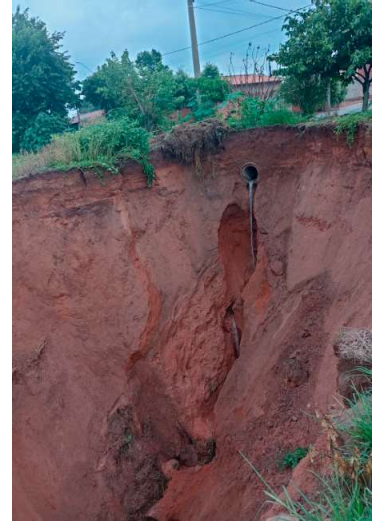
Erosão está a cada dia mais perigosa