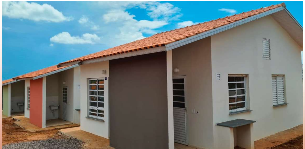
Encontro com representantes da CDHU confirma 58 novas unidades que deverão ser construídas na região Sul