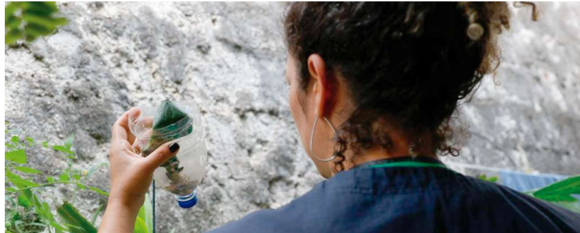
Panel de monitoramento do Estado aponta mais de 5 mil testes positivos registrados em Marília

Levantamento feito pelo jornal O DIA mostra que a cidade possui a maior parte dos casos do grupo de vigilância composto por 37 municípios P3