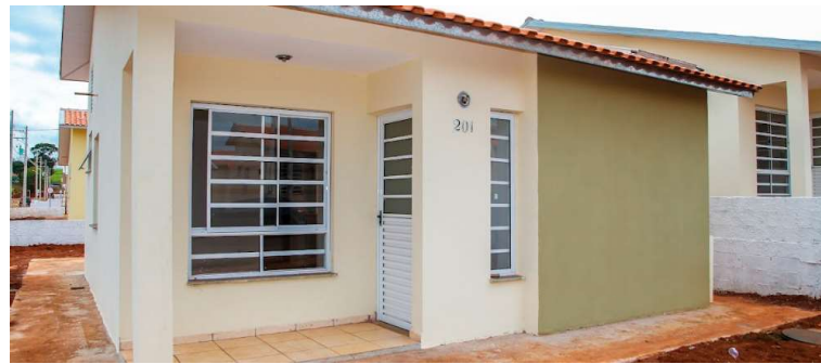
Casa construída pela CDHU; Vera Cruz tem projeto com mais de 50 residências