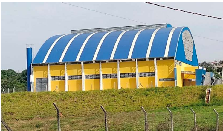
Imagem do Cemesc de julho de 2023, três meses após o início da reforma do espaço

Agora, em aditivo deste mês, a prefeitura deu mais 120 dias para conclusão.