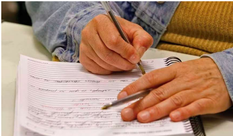
As inscrições vão até 26 de abril, no site do Sesi e as aulas começam em maio

São dois tipos de cursos: a “Nova EJA”, que abrange os anos finais do ensino fundamental (do 6º ao 9º ano) e o ensino médio (do