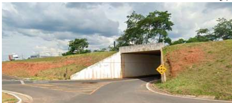
Dispositivo está localizado no km 443+400 da rodovia João Ribeiro de Barros