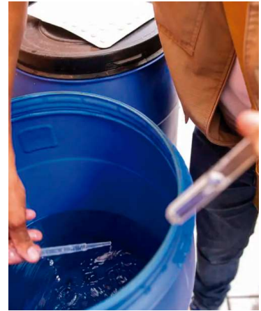
Cidade concentra maior parte dos casos