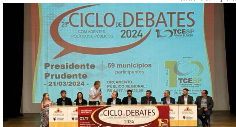
Encontro realizado em Presidente Prudente pelo TCE; debate da região será em Bauru