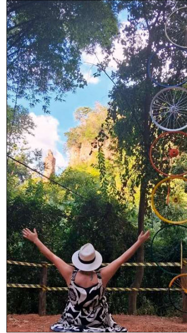
Portal tem ao fundo conhecida pedra