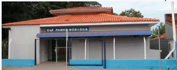
Unidade de Saúde localizada na região Norte de Marília recebeu manutenções