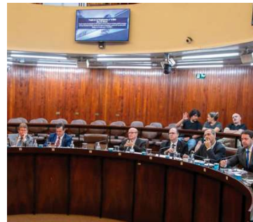
Todas as pautas do dia foram aprovadas