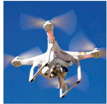
Empresa deverá mapear criadouros