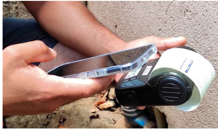
Empresa ficará responsável pela locação de sistemas de leitura da conta de água

Valor da publicação: R$ 26,88 - Tiragem: 3,4 mil exemplares. Conforme Lei Municipal Nº 2.650, de 30 de março de 2016