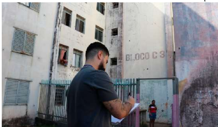
Moradores do CDU devem ser removidos e realocados até o final deste mês

Valor da publicação: R$ 252,00 - Tiragem: 3,4 mil exemplares. Conforme Lei Municipal Nº 2.650, de 30 de março de 2016