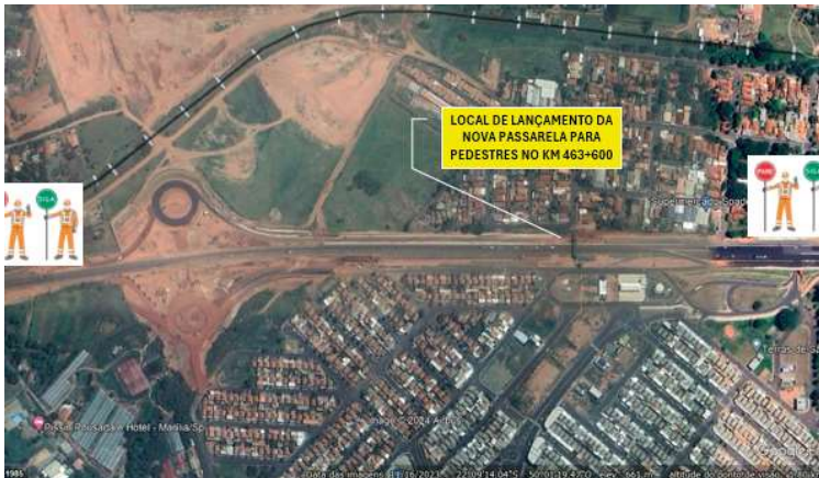
Imagem indica local onde será construída a nova passarela para pedestres

Parte dos trabalhos de duplicação da rodovia, um novo dispositivo de retorno será instalado no km 461, próximo ao Posto Ecológico, na zona Norte de Marília. Até a finalização desta etapa das obras, que começa nesta segunda (8), os motoristas contarão com o sistema "pare e siga". Durante cerca de 30 dias, a orientação para moradores da região, que inclui o distrito de Padre Nóbrega e os bairros Montana, Maracá e Trieste, é utilizar