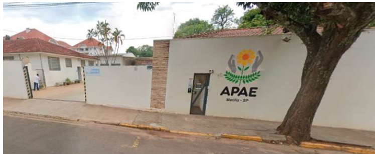
Vista da Apae, entidade que fica na região Sul; feira ocorre nos dias 10 e 11 de maio