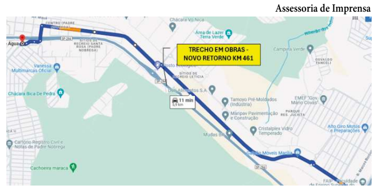
Assessoria de Imprensa

Rodovia Comandante João Ribeiro de Barros tem novas obras para implantação de um dispositivo de retorno e passarela; novo radar começa a funcionar na mesma via P7