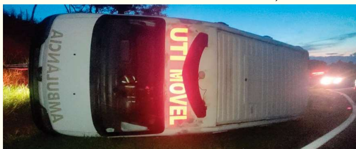
Ambulância tombou na SP-294 na noite da última terça-feira; sem feridos