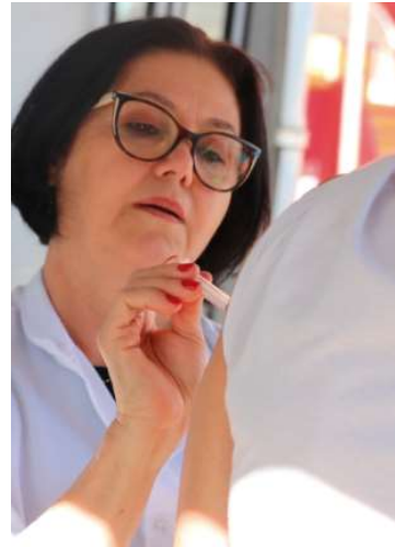
Público-alvo é definido pelo Governo