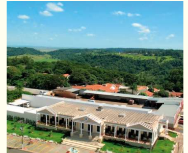
Alterações constam em atos oficiais