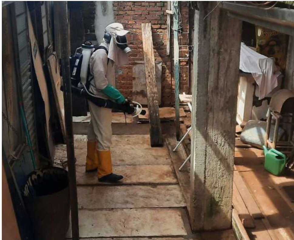
Trabalhos são feitos por agentes comunitários de saúde e de controle de endemias; ação começa no próximo sábado