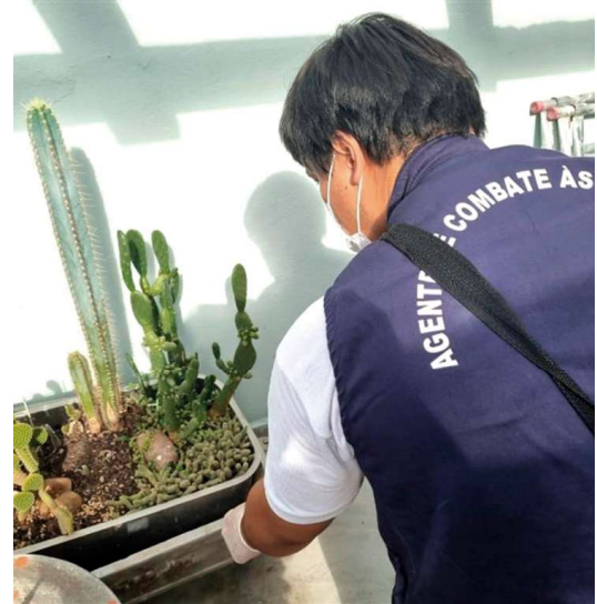
Recurso federal agora pode ser utilizado no enfrentamento

Marília abre crédito de R$ 770 mil para combate da dengue P3