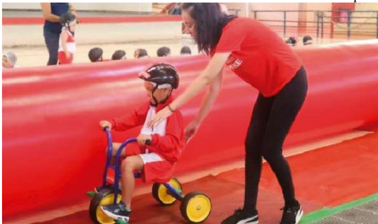
O projeto busca ensinar sobre cidadania no trânsito através de experiências lúdicas

Segundo os organizadores, o projeto busca ensinar os alunos sobre cidadania e trânsito através de experiências lúdicas. Uma série de elementos é montada para simular uma cidade com ruas, edifícios e sinalizações de trânsito. As crianças assistem então a uma apresentação de teatro que traz princípios de cidadania, meio