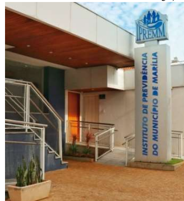
Pedido será avaliado pelos vereadores