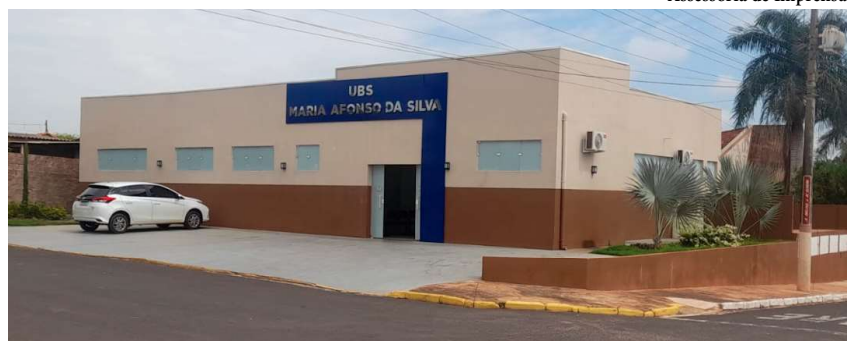
Ação tem como objetivo incentivar, no primeiro momento, o público-alvo a procurar pelo imunizante