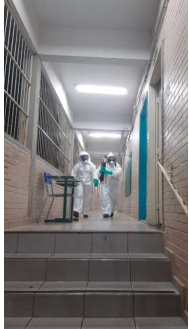
Nebulização contra dengue é realizada