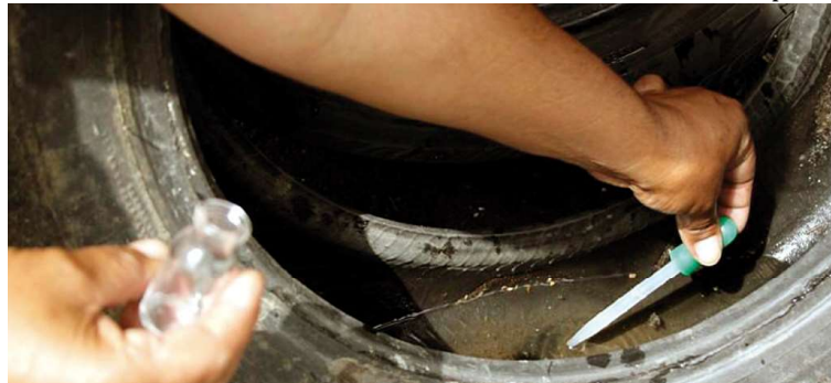
Agente durante ação de combate à dengue; os mutirões estão sendo intensificados

Entre as medidas que a população deve adotar estão manter quintais e lotes limpos, não depositando lixo e entulhos, eliminar recipientes que possam acumular água e se tornar criadouros do vetor, e permitir que os agentes tenham acesso ao imóvel para realizarem o tratamento focal. Con-