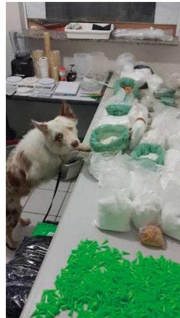
Cão farejador ajudou a localizar as drogas

Valor da publicação: R$ 252,00 - Tiragem: 3,4 mil exemplares. Conforme Lei Municipal Nº 2.650, de 30 de março de 2016