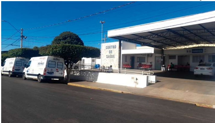
Moradores poderão se vacinar em dois locais, com atendimento no próximo sábado