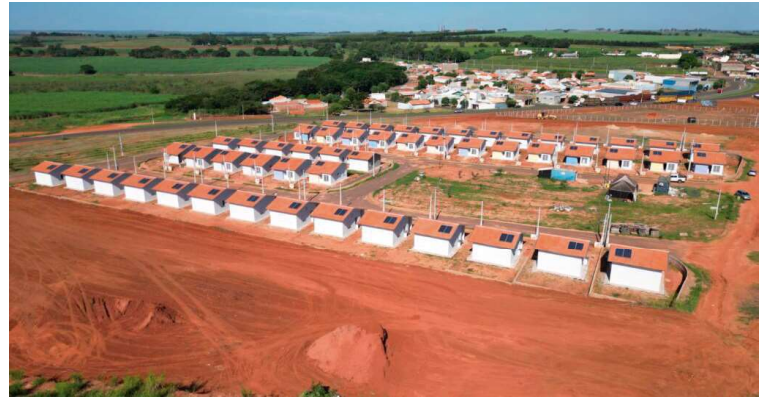
Recursos serão direcionados para melhorias das vias; projeto foi entregue à CDHU