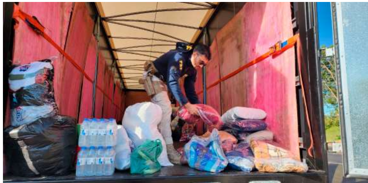
PRF recebe doações; marilienses têm se mobilizado para fornecer toda ajuda possível

TRT /O TRT-15 (Tribunal Regional do Trabalho da 15ª Região), a Amatra XV (Associação de Magistrados da Justiça do Trabalho da 15ª Região), o Sinquinze (Sindicato dos Servidores Públicos Federais da Justiça do Trabalho da 15ª Região) e a OAB (Ordem dos Advogados do Brasil) uniram forças na campanha solidária SOS/RS-15.