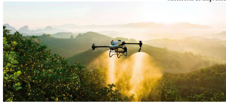
Drone pulveriza área agrícola; Jacto passa a oferecer esta tecnologia em seu portfólio