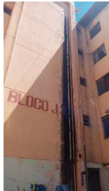
Decisão foi publicada nesta terça-feira