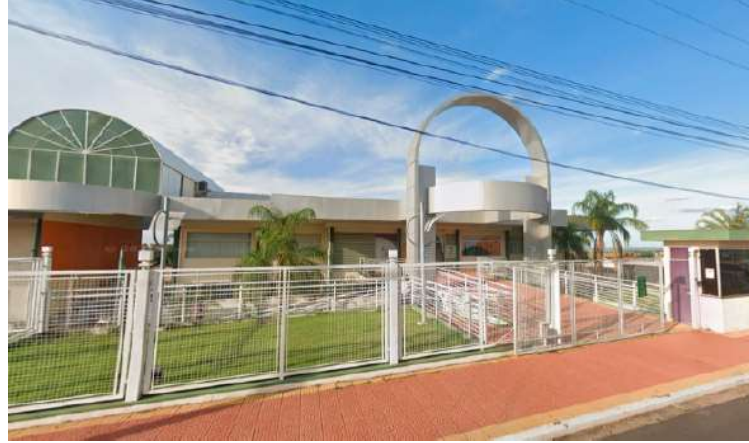
Caminhada será realizada com saída do Instituto de Desenvolvimento Familiar

Secretaria da Família realiza reuniões com monitoras escolares, agentes comunitárias e membros dos grupos do Cras (Centro de Referência da Assistência Social), para estudos sobre novos progra-