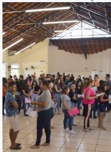
Feira de empregos reuniu 300 pessoas