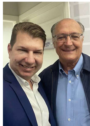
Itapuã com o vice-presidente Alckmin