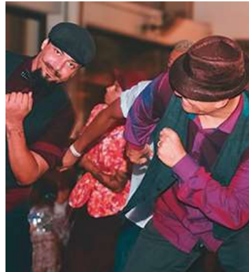
Evento será neste sábado em Marília

intervenção em contextos socioculturais, a partir de reflexões e exercícios práticos.