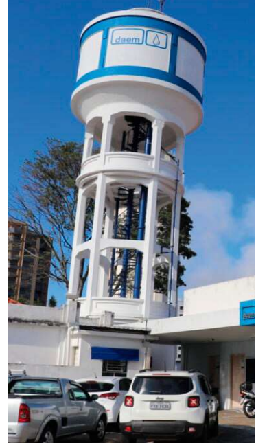
Propostas devem ser enviadas até o dia 22