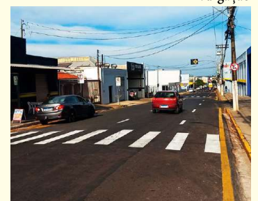
Trecho da avenida recebeu revitalizações