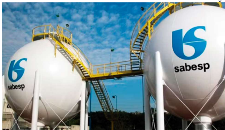
Reservatório da Sabesp; aumento da tarifa de água, de 6,4%, já está em vigor