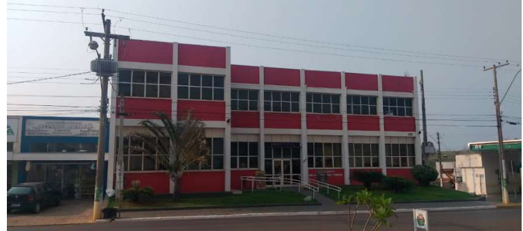
Vista da Prefeitura de Ocaçu, onde os estagiários vão cumprir jornada de trabalho

Conforme o edital 1/2024, para os estudantes do ensino superior, a bolsa-auxílio oferecida é de R$ 500 para cumprimento de uma jornada de cinco horas diárias. Já para os do ensino médio, a bolsa