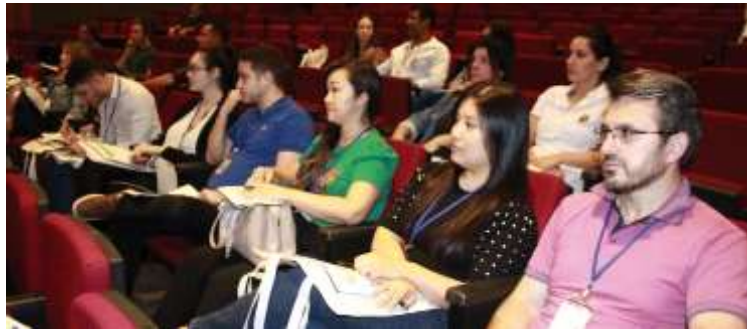
A capacitação foi realizada no Teatro Municipal na última quinta-feira, dia 13