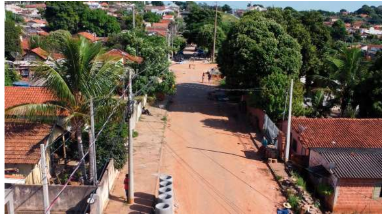
Prefeitura afirma que via ficará livre de alagamentos e transtornos para os moradores