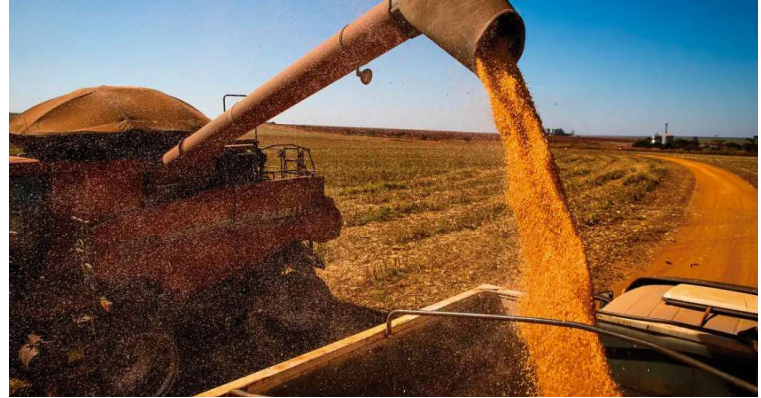
Produção de grãos projetada está 7% menor, com 297,54 milhões de toneladas

A situação do arroz é bem melhor do que o cenário sugerido em meio às enchentes registradas no Rio Grande do Sul,