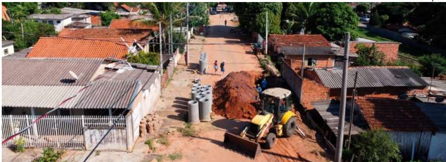
Prefeitura de Vera Cruz divulga o andamento da obra na rua 13 de Maio, que passa pela segunda etapa com a instalação de galerias pluviais; via deve ficar livre de alagamentos