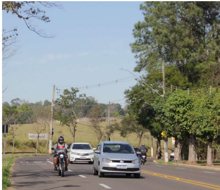
As novas desapropriações foram divulgadas por meio de decreto no Diário Oficial