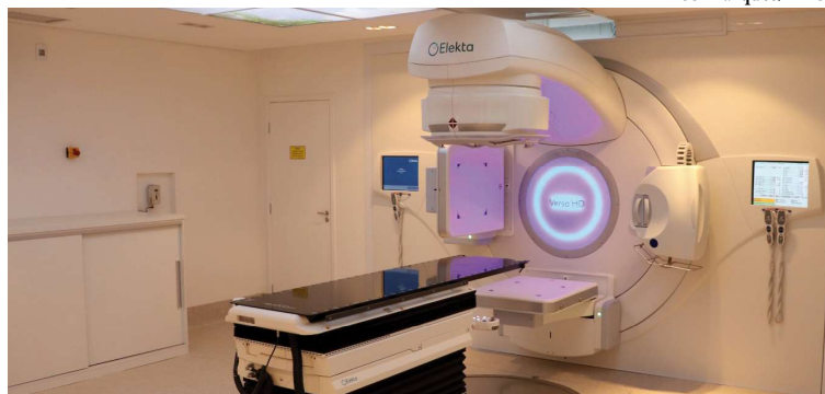
Foto do acelerador linear já instalado; tratamentos devem complementar assistência na cidade