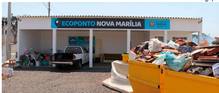
Situado no Nova Marília, o local recebe materiais que não podem ser descartados no lixo comum