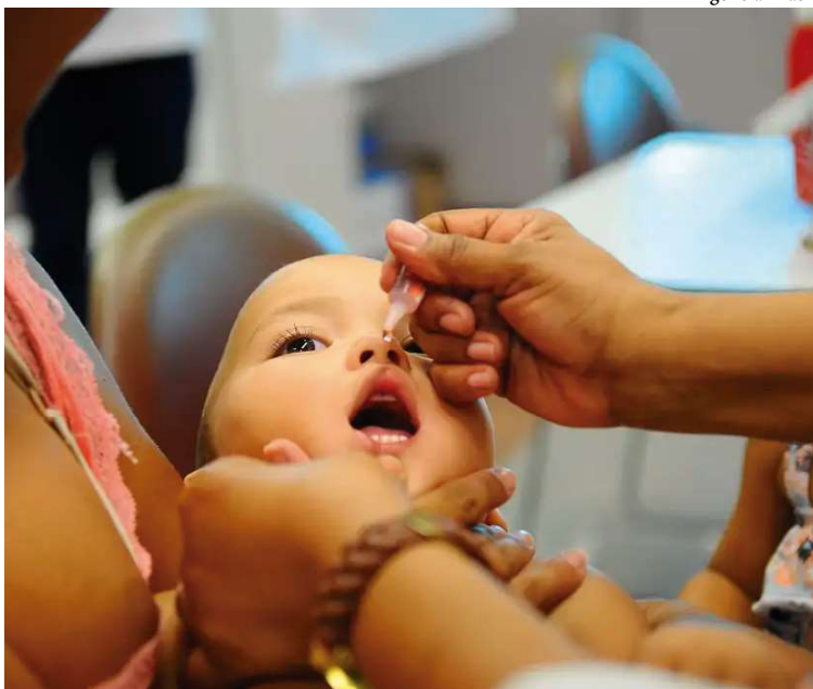
Estado estende a Campanha Nacional de Vacinação contra a Poliomielite até o final de junho