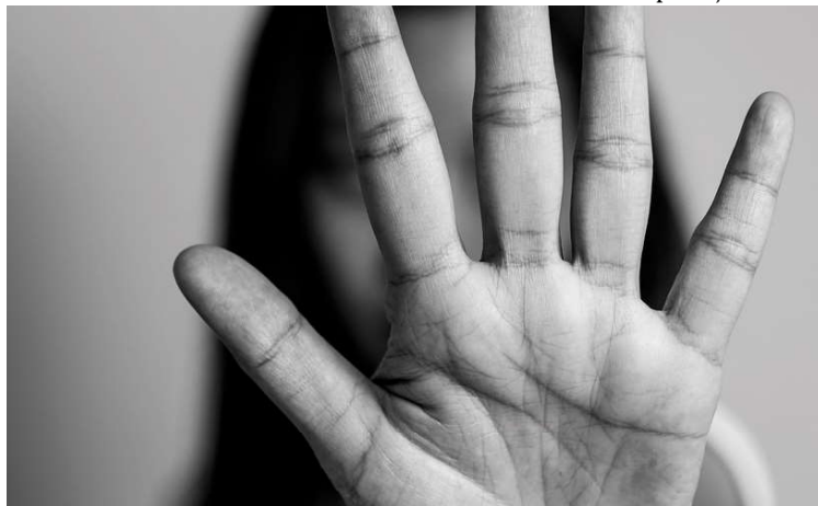
Número de mulheres vítimas de violência no estado é bem maior que no ano passado

Caberá ao Executivo federal gerir o cadastro, compartilhando informações dos estados e municípios. Além disso, deve haver atualização periódica e o nome da pessoa condenada deve ficar disponível até o término do cumprimento da pena ou pelo prazo de três anos, se a pena for inferior a esse período.